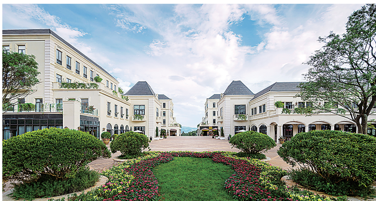
七彩云南·古滇名城滇池国际养生养老度假区活力小镇