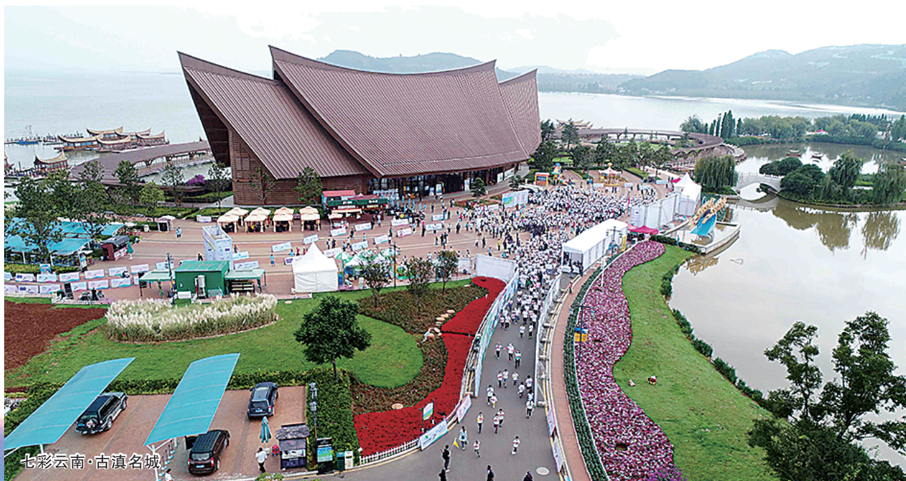
七彩云南·古滇名城