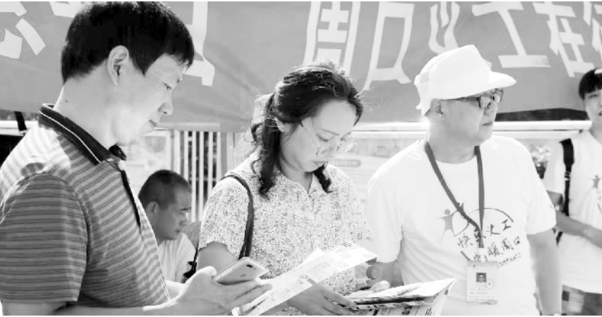
9 月 5 日是第四个“中华慈善日”，为进一步弘扬慈善文化，市民政局、市慈善事业服务中心以及市慈善总会各工作委员会共同开展以“弘扬慈善文化、构建大爱周口”为主题的系列慈善活动。图为志愿者在开展义诊服务。

法规知识等进行了细致讲解和指导。据了解，今年市市场监督管理局在黄淮市场共安排抽检 421 批次，涉及酱卤肉、食用农产品等 20 个细类。中国检验认证集团中原公司也按照要求规范抽样检验，确保重点品种、经营户 100%覆盖。 据介绍，市市场监督管理局近期还依托“创卫”工作，在开展食品“三小”专项排查的同时，安排“双节”期间食品安全监督抽检 2960 批次，主要包括粮油、蔬菜、水果、月饼、肉蛋、肉肉等品种，重点覆盖农贸市场、餐饮单位、单位食堂等群众消费量大的单位，以确保全市人民群众“双节”期间饮食健康安全。②3