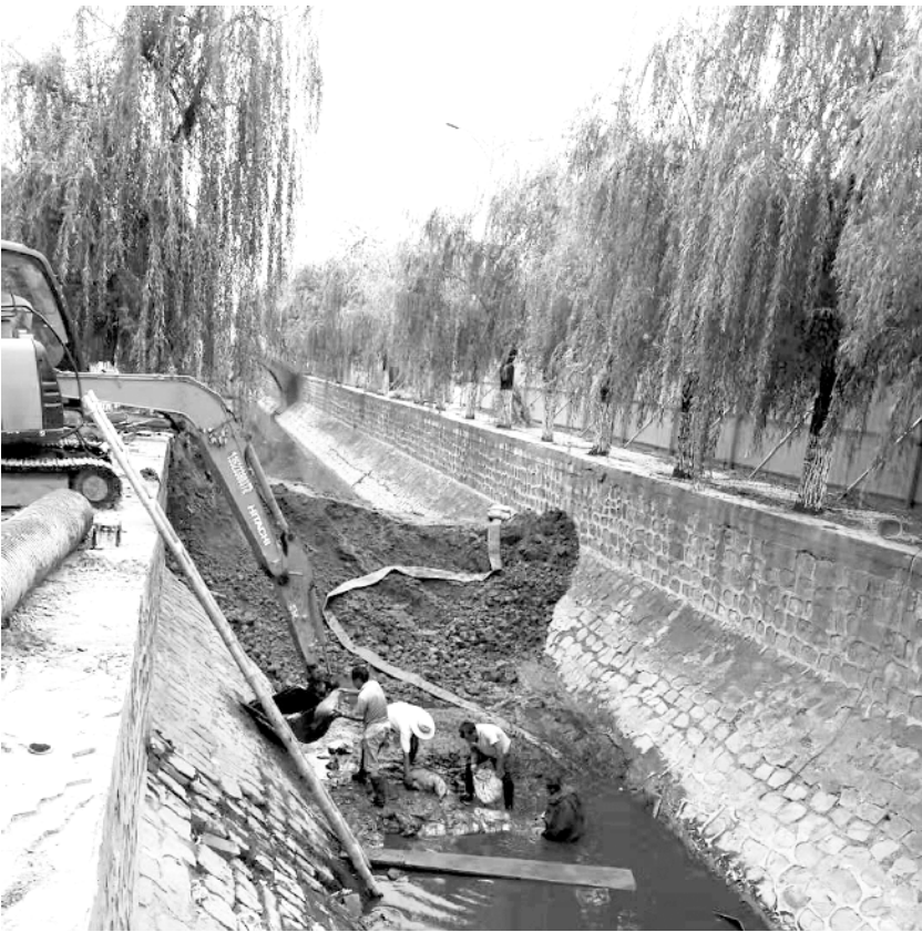
整治中的交通干渠

全力提升中心城区污水处理能力 为确保按时完成治理目标任务，市城管局、设计单位与水利局 PPP 项目及时对接，将水系综合治理与控源截污等项目紧密结合，分类汇总，确保项目顺利推进。据了解，目前项目合同已签订，投资方和施工方已确定，下一步将统筹解决项目区域征迁问题，加快工程建设进度，力争明年年底全面完成 7 条水系综合治理建设任务。目前项目已完成洼冲沟、幸福河、贾东干渠、杨脑干渠 4 条黑臭水体治理，今年年底前将完成流沙河、运粮河、交通干渠 3 条黑臭水体治理，等待全国城市黑臭水体监管平台销号系统开启后即完成销号工作。 同时，按照专项规划与污水管网“健康度”检查结果，今年我市将逐步完善中心城区污水管网建设工程，对八一大道、太昊路及莲花路等污水管网进行改扩建，提高污水管网收集率。启动排水泵站改扩建工程，改造杨脑、孙猴庙、三连坑雨水、三连坑污水、荷花、复兴街、太昊路东、太昊路西、周淮路 9 座排水泵站，提高污水传输能力。推进河西和港区污水处理厂新建扩建工程，不断提升中心城区污水处理能力。②3