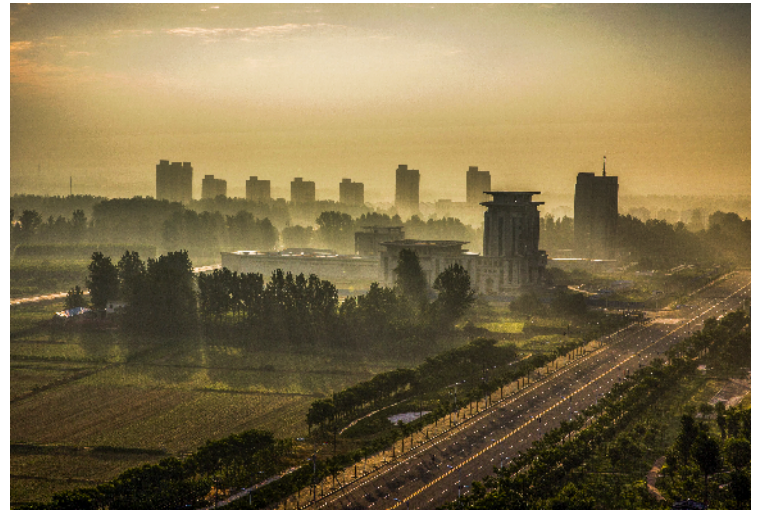
魅力扶沟