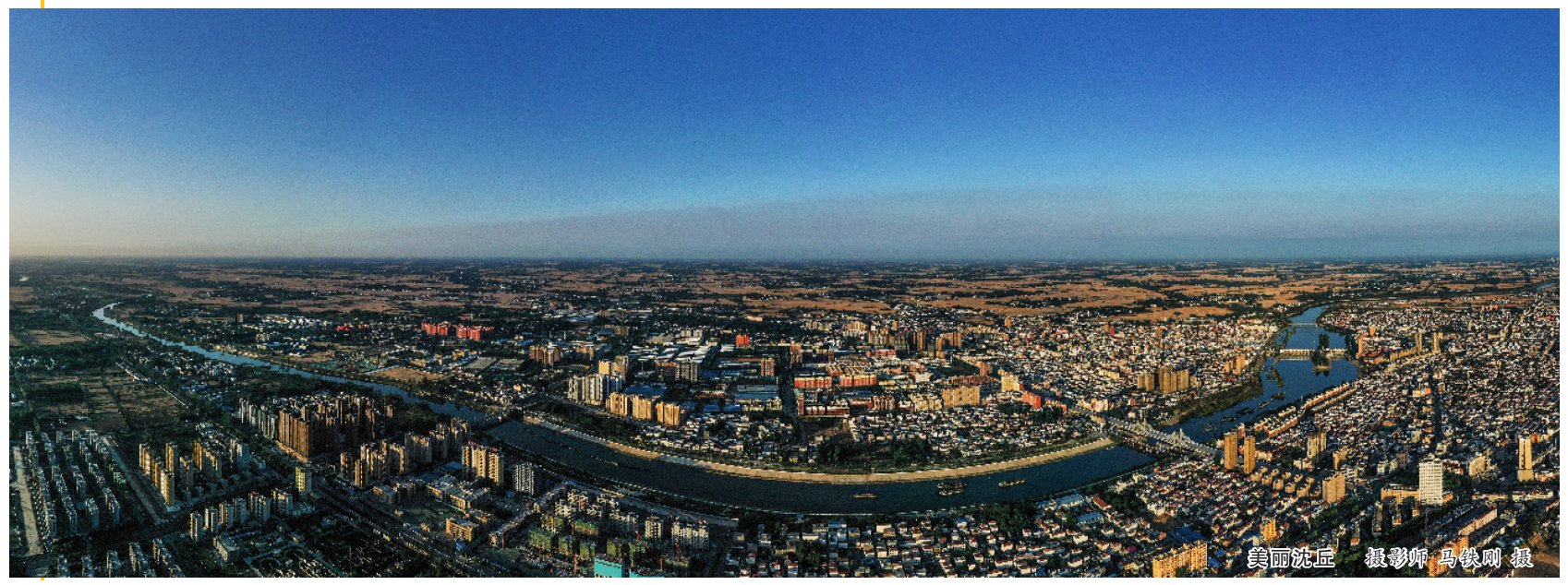
美丽沈丘