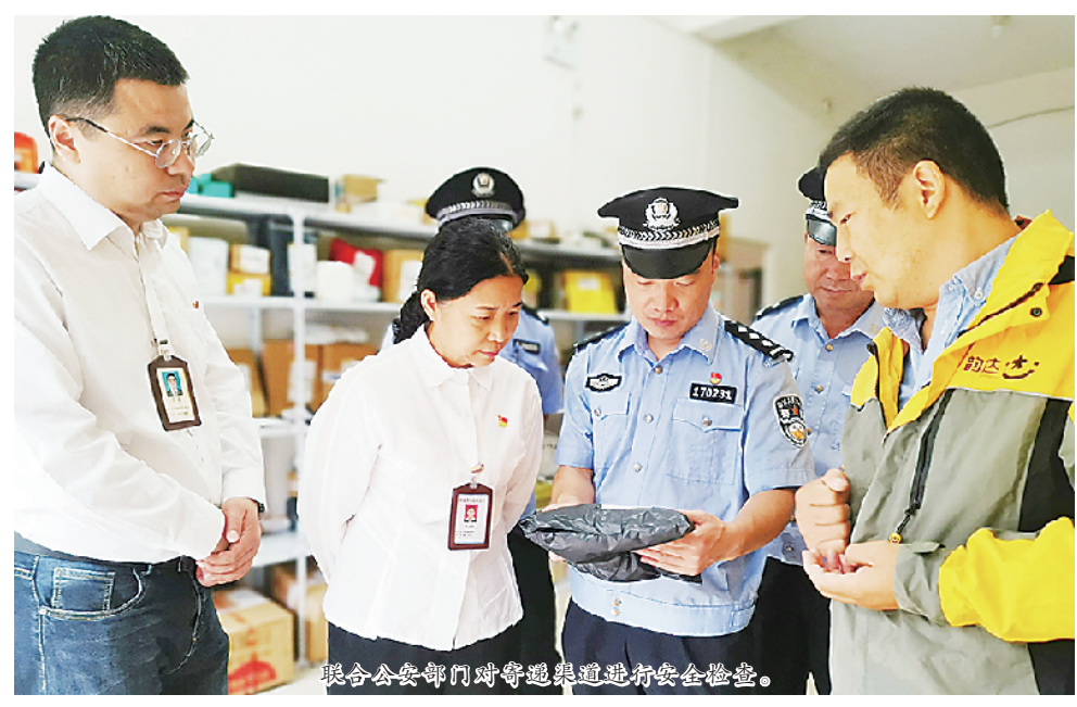
联合公安部门对寄递渠道进行安全检查。

站在新的历史起点上，在市委、市政府和省邮政管理局的坚强领导下，市邮政管理局将充满坚定信心和必胜信念，精准把握全市邮政业发展的趋势和特征，着力提高战略思维和决策能力，不断增强工作的原则性、系统性、预见性和创造性，以新的精神状态和奋斗姿态决胜全面建成与小康社会相适应的现代邮政业，以优异成绩为新中国成立70周年献礼。