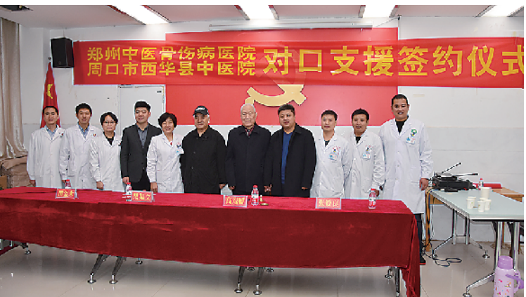
对口支援签约仪式