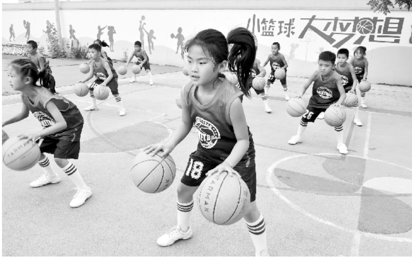
农村小学的快乐篮球 9月27日,三福庄小学的学生在课间练习运球。近年来,河北省三河市三福庄小学按照“一校一品”的办学思路,开发校本课程“特色篮球”,创建以篮球为主题的校园文化,实现在校学生全员参与,不仅在多次比赛中取得佳绩,同时也推动全民健身活动的深入开展。

据自治区统计局数据,2018年新疆棉花播种面积达3737万亩,比上年增长12.4%,新疆棉花产量达511.1万吨,比上年增长11.9%,占全国的83.8%,棉花产量再创新高。