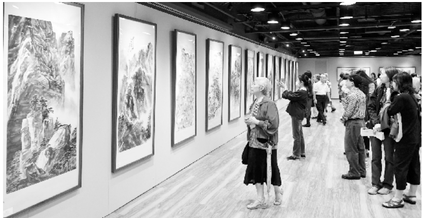
两岸艺术家共绘黄山书画作品展在台北举行 9月27日,观众在两岸艺术家共绘黄山书画作品展上参观。当日,两岸艺术家共绘黄山书画作品展在台北举行。

据了解,大瑞铁路东起大理,西至瑞丽,全长约331公里,设计时速140公里,是中缅国际铁路通道的重要组成部分。高黎贡山隧道全长34.538千米,是我国铁路第一长隧。