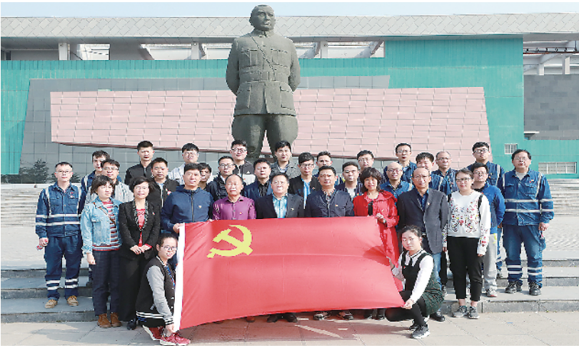
廉政教育月主题活动