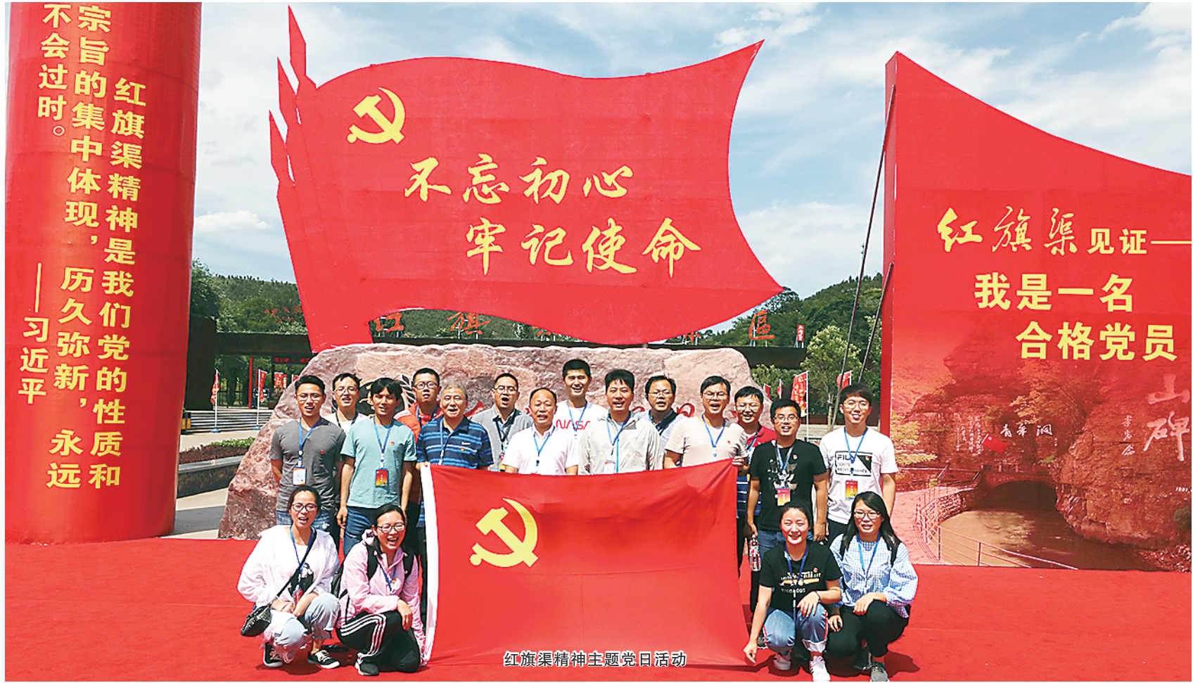
红旗渠精神主题党日活动