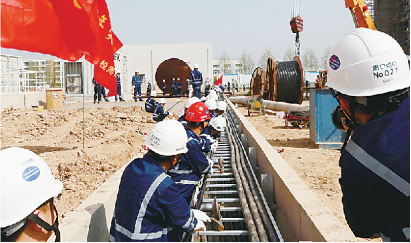
党员义务劳动,敷设电缆,助力项目建设