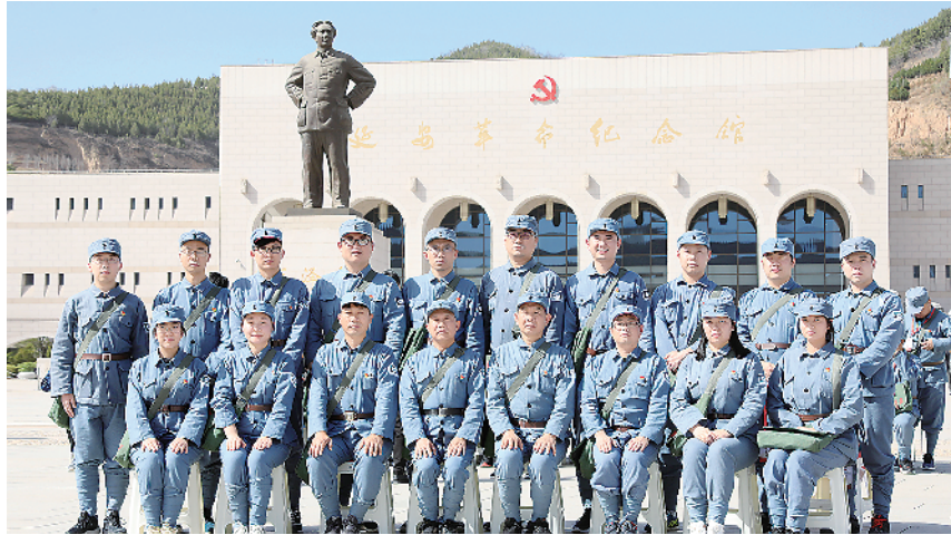
“弘扬延安精神、传承红色基因”主题教育培训