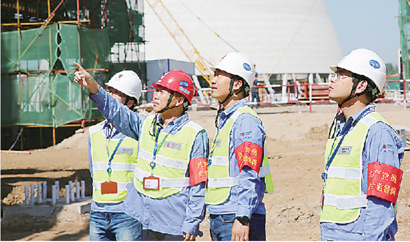
党员代表在施工现场安全巡视