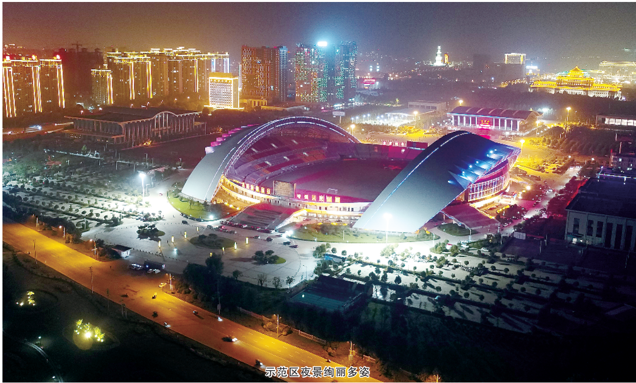
示范区夜景绚丽多姿