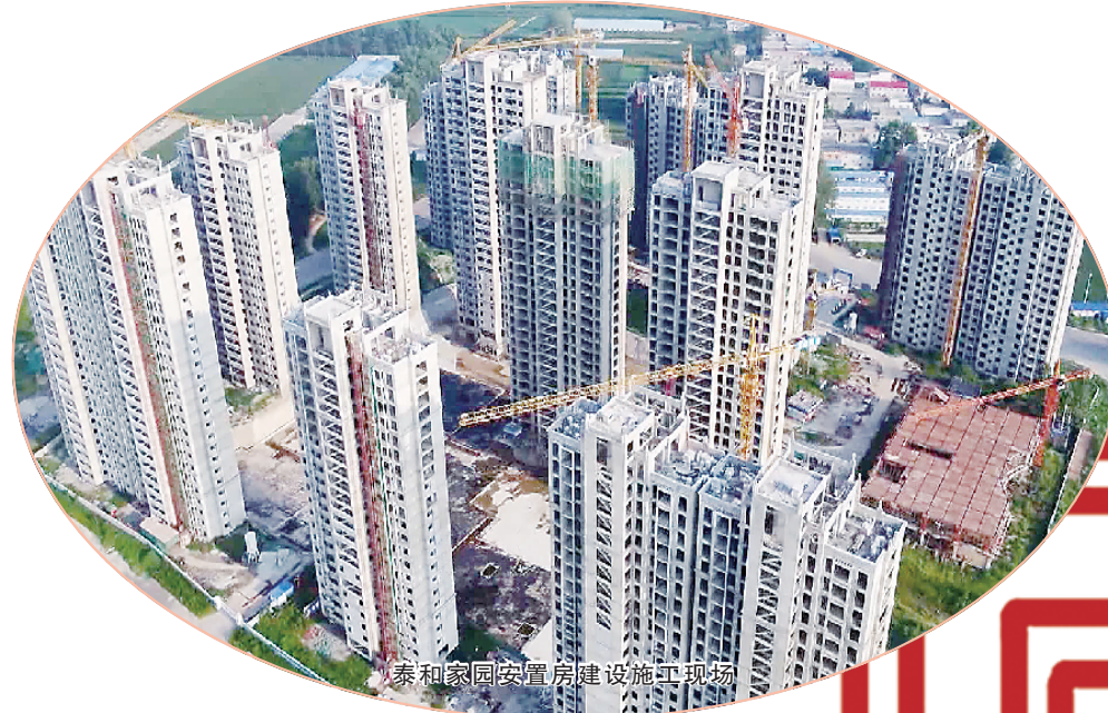
顺和家园安置房建设施工火热