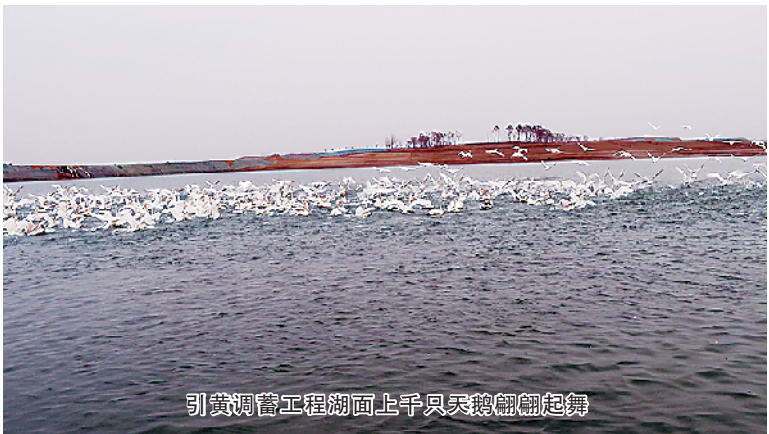
引黄调蓄工程湖面上千只白鹭筑巢建巢