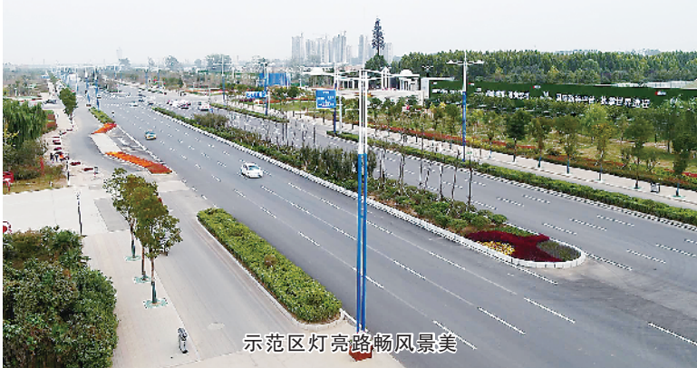
示范区灯亮路畅风景美