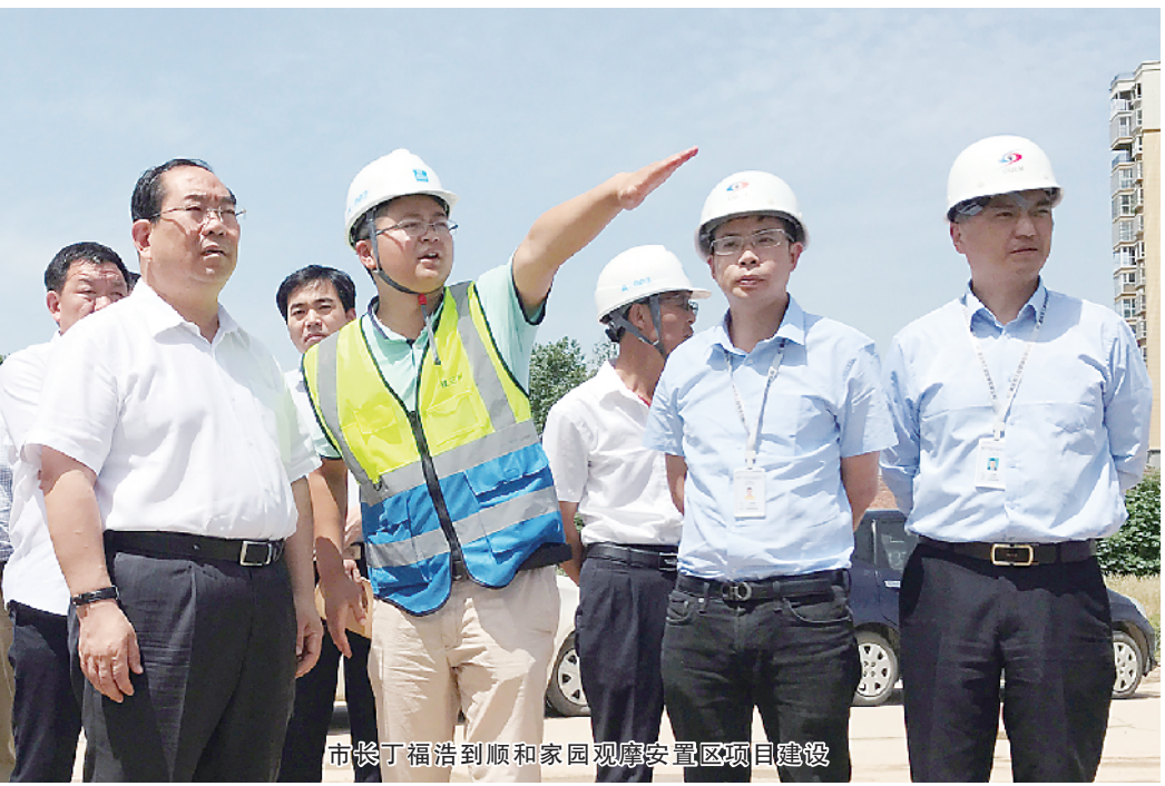
市长丁福浩到顺和家园观摩安置房区项目建设