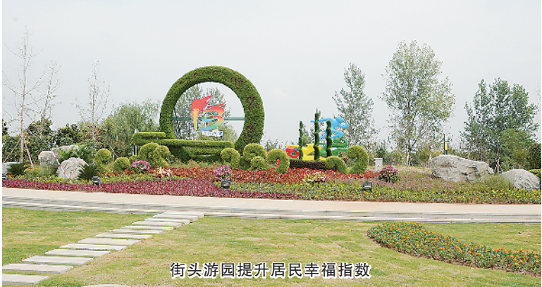
街头游园提升居民幸福指数