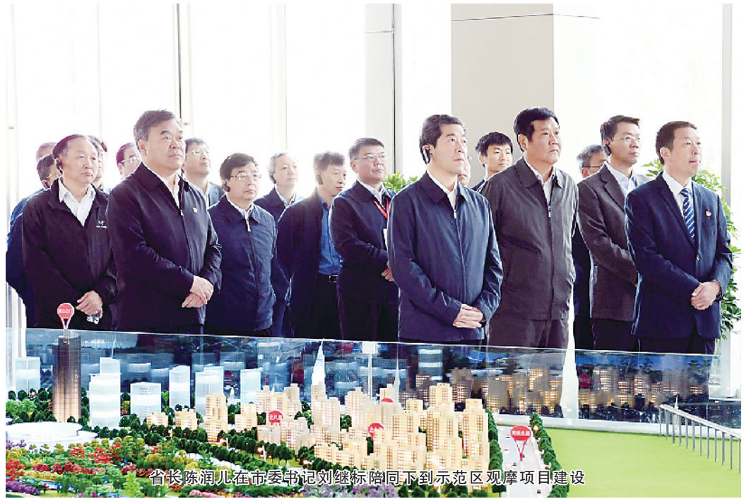
省领导在市委书记刘继标陪同下到示范区观摩项目建设