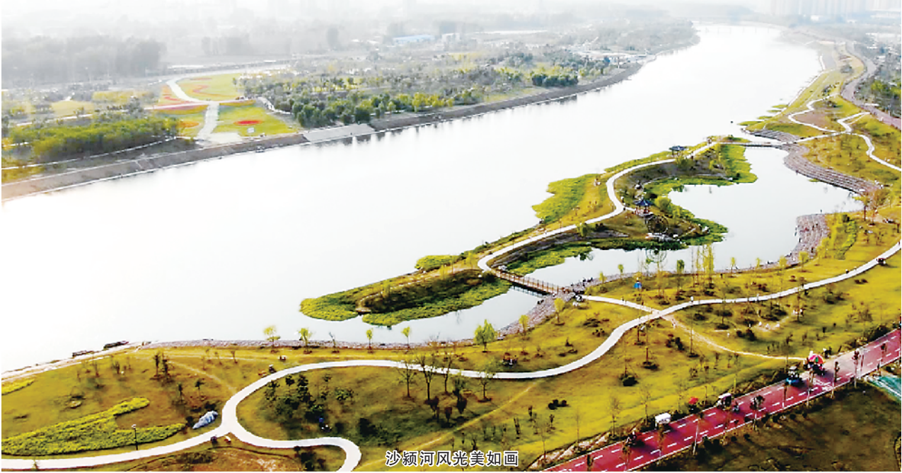
沙颍河风光美如画