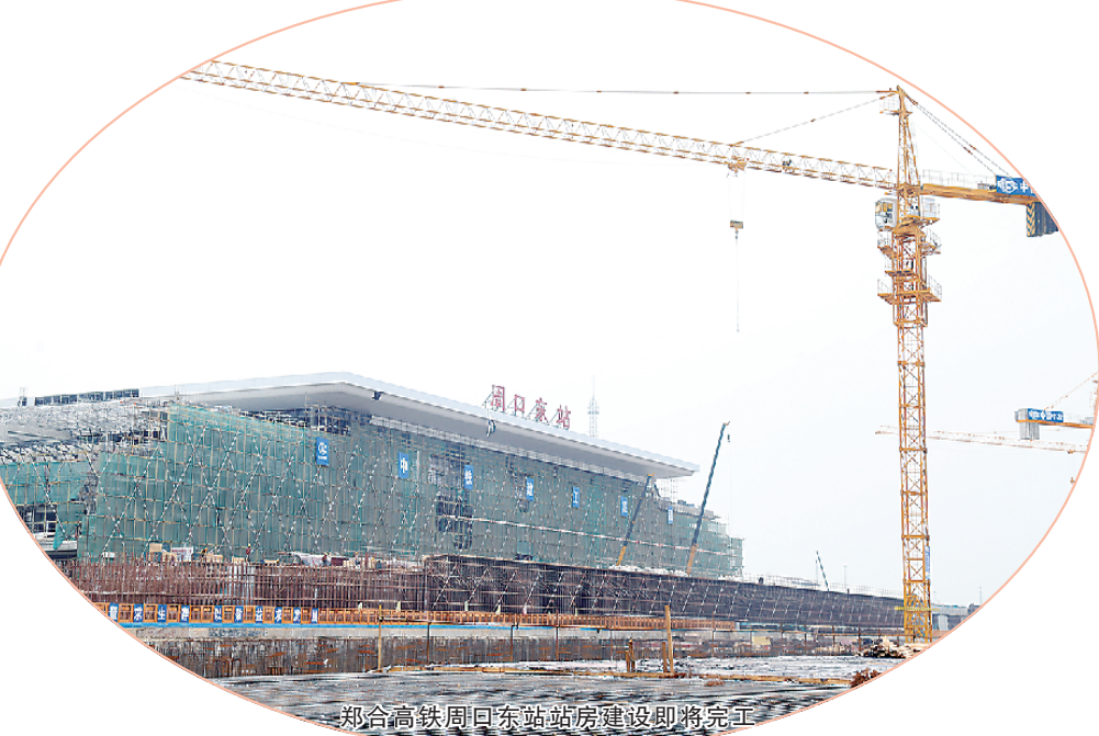
郑合高铁周口东站站房建设即将完工