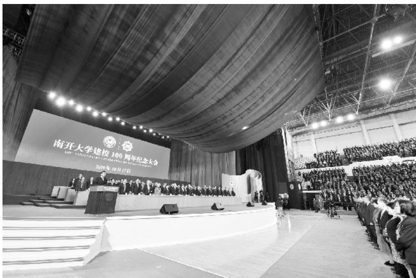
南开大学举行建校100周年纪念大会

建立全面合作、共同发展、面向未来的中阿战略伙伴关系,中阿友好合作进入历史新阶段。希望中阿双方携手努力,推动媒体融合发展,打造智慧广电媒体,发展智慧广电网络,为增进中阿民心相通、推动中阿战略伙伴关系发展作出更大贡献。