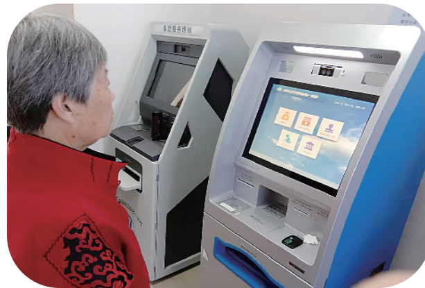
市民用社会保障卡自助服务设备办理业务