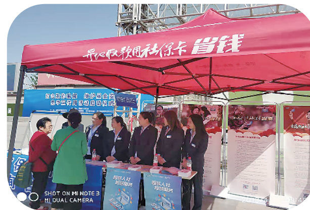
“12333”工作人员为市民讲解政策