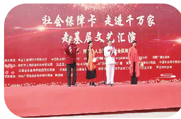
社会保障卡宣传进基层文艺汇演