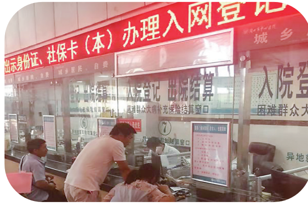
市民用社会保障卡办理住院结算手续