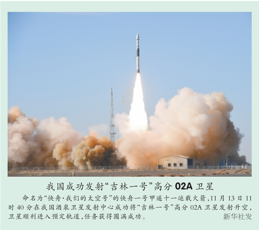
我国成功发射“吉林一号”高分02A卫星 命名为“快舟·我们的太空号”的快舟一号甲遥十一运载火箭，11月13日11时40分在我国酒泉卫星发射中心成功将“吉林一号”高分02A卫星发射升空，卫星顺利进入预定轨道，任务获得圆满成功。

阿曼国家委员会成员等各界人士积极支持中国和阿曼共建“一带一路”，认为“一带一路”有助于阿中关系不断发展。 阿曼国家委员会成员哈特姆12日在接受采访时表示，阿中两国都有加强合作的强烈愿望，去年宣布建立战略伙伴关系，签署了政府间共建“一带一路”谅解备忘录，双方在“一带一路”框架下的合作不断提升。 “中国是世界第二大经济体，中国对