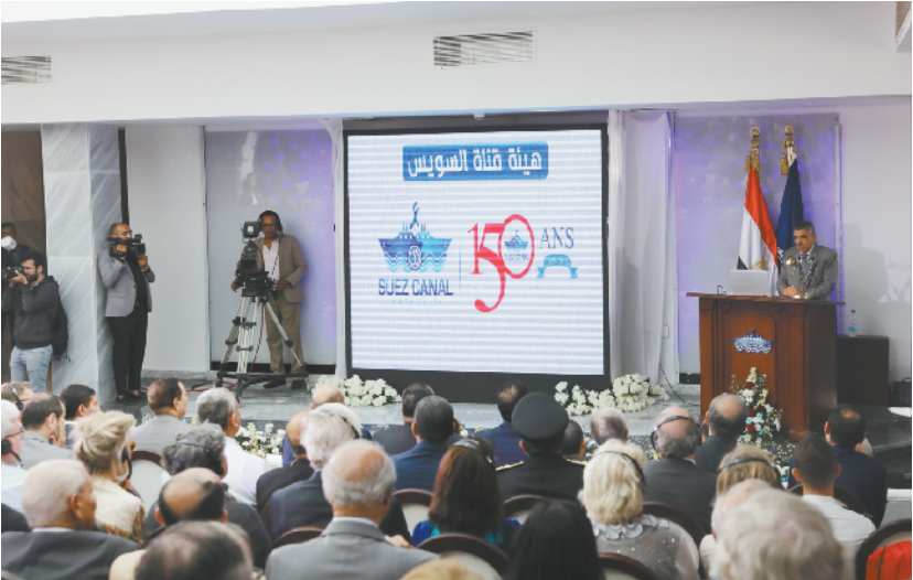
埃及举行仪式庆祝苏伊士运河通航150周年

试验和例行训练。这次组织国产航母跨区开展试验和训练，是航母建造过程中的正常安排，不针对任何特定目标，与当前的局势无关。