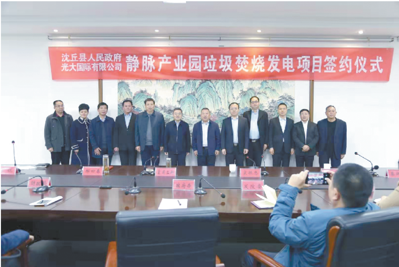
音)、经得起测（严格检测达标排放），以高度的社会责任心，把项目打造成精品工程、标杆工程、平安工程，全力配合沈丘生态文明建设，为打造美丽

宋振忠介绍了光大国际有限公司的发展经营情况，同时承诺将严格落实“三个零”标准，即零超标排放、零安全事故、零违规违纪，坚决做到“四个经得起”，经得起看（花园式环境）、经得起闻（没有异味）、经得起听（没有噪