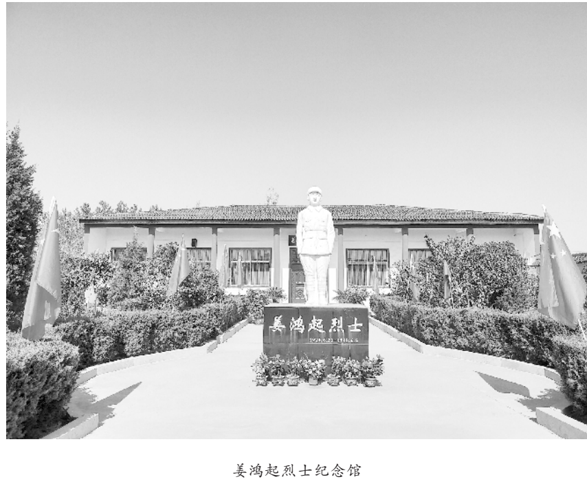
姜鸿起烈士纪念馆