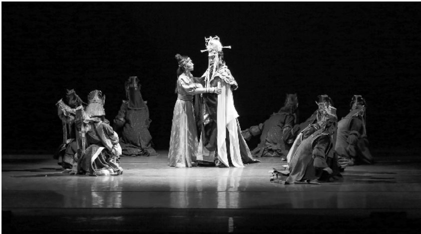
《昭君出塞》亮相美国圣迭戈 12月1日,在美国圣迭戈,演员在《昭君出塞》中表演。当日,中国演员李玉刚主演的诗意图舞剧《昭君出塞》在美国圣迭戈进行北美首演。该剧融合传统东方美与现代舞台艺术,吸引大批观众前往观看。

美国警惕。出于对“美国优先”、北约似乎难再靠得住的担忧,欧盟谋求加强自主防务。美方担心,这会引发北约与欧盟在防务方面“不必要的竞争”,也会对美军工企业出口形成威胁。 难以适应时代潮流。北约是冷战对抗的产物,所以在冷战结束后,就一直有声音认为,北约已无存续的必要。如今的北约,尽管试图不断调整自身职能,且努力把触角扩张到全球各个角落,但是在,世界各国相互深入融合、追求和平发展的今天,这样一个带有对抗“基因”的组织,始终面临自身定位的困惑,也常常成为一些地区紧张局势的推手。俄罗斯外交和国防政策委员会主席卢基扬诺夫给北约未来把脉说:“若是本质不变,它转而履行更广泛的全球性职能就注定会失败。” 在不久前举行的北约部长级会议上,蓬佩奥煽风点火,要求北约将应对“中国威胁”作为新的任务。这种陈旧的冷战和霸权思维,没有得到北约其他成员国的认同。马克龙认为,恐怖主义才是北约共同的敌人。德国联邦议院左翼党团称,北约所声称的目标是让世界变得更加和平,但“事实并非如此”,尤其是美国,到处建立军事基地,破坏和平。 思路决定出路,格局决定结局。霸权和对立不可能让北约找到自己的未来。如果顾顺时代潮流,顾顺国际社会希望合作共赢的普遍期待,北约恐怕只会越发与时代格格不入,越发难脱“迷茫”,乃至彻底“找不着北”。(新华社北京12月3日电)