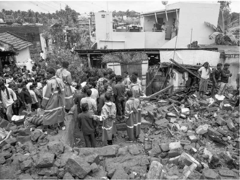
印度泰米尔纳德邦房屋倒塌致15人死亡 12月2日,在印度泰米尔纳德邦,救援人员在房屋倒塌现场工作。由于连降暴雨,印度南部泰米尔纳德邦2日凌晨发生房屋倒塌事件,造成至少15人死亡。

新华社突尼斯12月2日电(记者 潘晓菁)的黎波里消息:利比亚民族团结政府军队和利比亚武装力量“国民军”2日在利首都的黎波里南部爆发激烈冲突,至少17人死亡。 民族团结政府卫生部新闻发言人法齐·厄内伊斯告诉新华社记者,冲突导致2名平民死亡,双方士兵均有伤亡。民族团结政府军队说,他们在冲突中打死15名“国民军”士兵,摧毁了10辆军车。 的黎波里南部居民说,在当地听到爆炸声和枪声,许多人开始逃离。