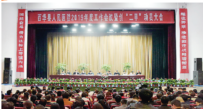
“二级甲等”综合医院创建大会