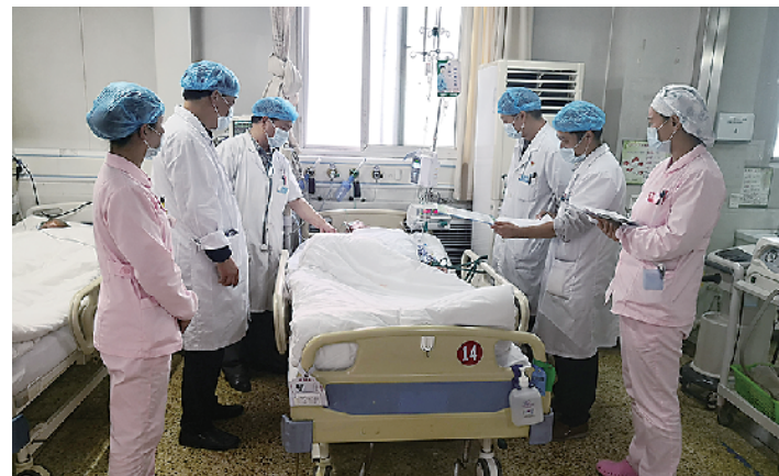
重症医学科间会诊