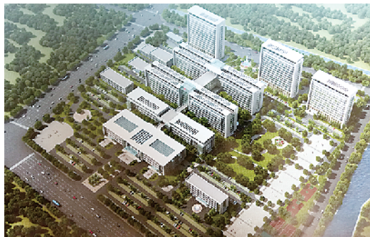
新院区正面透视图

“随着我院的新院区明年下半年正式投入使用,再加上成功创建‘二级甲等’综合医院,届时,我院将建成‘立足西华,辐射周边,总体布局合理、医院管理科学规范、资源配置优化、学科建设领先、医疗技术优良、科研教学配套、医疗服务满意’的集医疗、预防、教学、科研、康复、养老于一体的综合医院,综合实力处于省内同类医院先进水平,为西华县97万人民群众的健康和西华全面建设保驾护航!”西华县人民医院院长闫耀生表示。