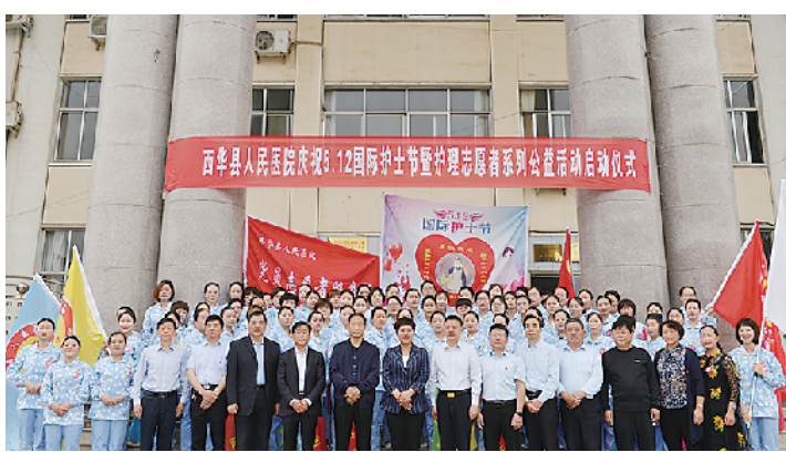
志愿者公益活动启动仪式