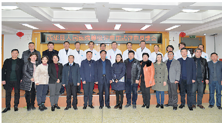
评审反馈会结束后合影留念

“西华县人民医院符合‘二级甲等’综合医院标准,顺利通过‘二级甲等’综合医院评审!”