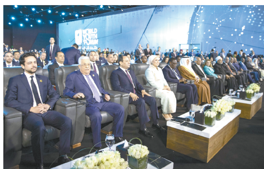
12月14日,在埃及沙姆沙伊赫,埃及总统塞西(左三)、巴勒斯坦总统阿巴斯(左二)等出席世界青年论坛开幕式。第三届世界青年论坛14日晚在埃及红海海滨城市沙姆沙伊赫开幕,来自多个国家和地区的7000余名青年代表参加论坛。本届论坛将持续至17日。论坛主题为和平、发展和创新,各国青年还将就食品安全、环境和气候、人工智能等议题展开讨论。