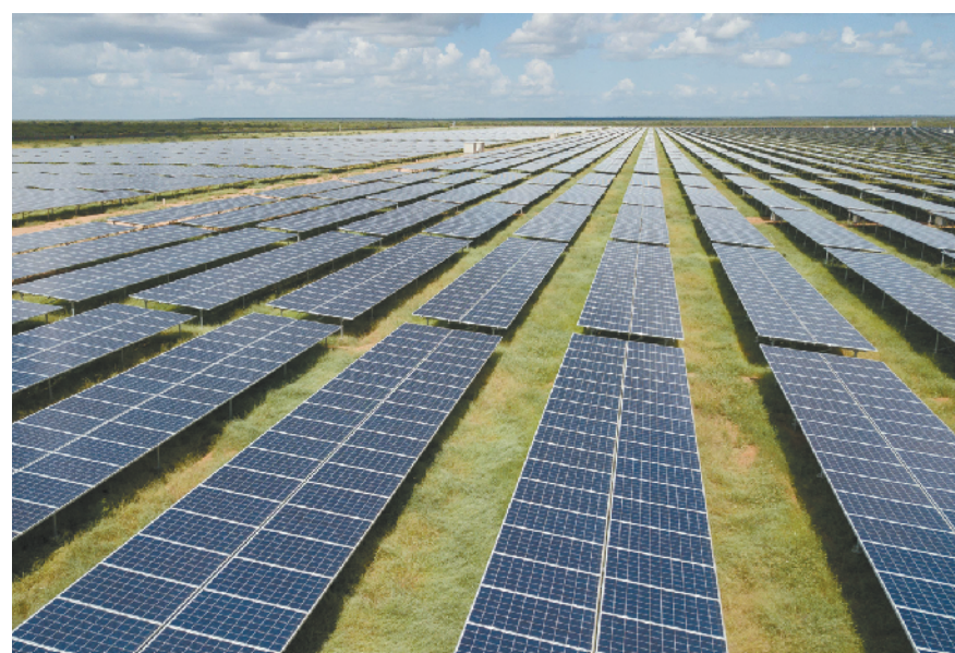
这是12月13日拍摄的肯尼亚加里萨50兆瓦光伏电站太阳能电池板。中企承建的东非最大光伏电站肯尼亚加里萨50兆瓦光伏电站13日正式投入运营。肯尼亚总统肯雅塔在投运启动仪式上致辞说,这一电站将为加里萨带来稳定供电,助力当地经济发展。