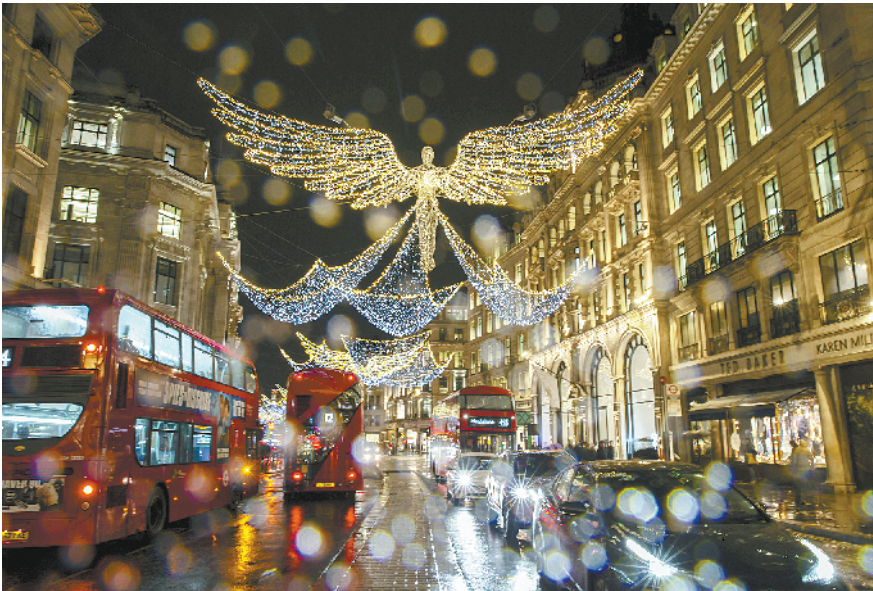
伦敦绚丽彩灯点亮缤纷新年 12月18日,在英国伦敦,车辆从摄政街的彩灯下经过。新年临近,伦敦市中心街道、商店纷纷点亮各式彩灯,迎接新年的到来。

间,吸引更多投资商,对塞尔维亚未来发展至关重要。 “昨天,从贝尔格莱德到(塞中部城市)查查克需要两个半小时,而今天只需要开车一个小时就能抵达,”武契奇说。 陈波表示,基础设施建设合作是中塞关系的重要组成部分,也是“一带一路”倡议的重要内容。她说,中国企业为塞尔维亚基础设施建设的快速发展所作贡献让人感到高兴。