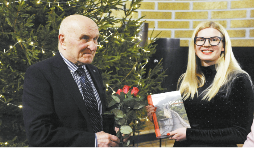
拉脱维亚汉学家贝德高新书发布会在里加举行 12月18日,在拉脱维亚里加的拉脱维亚大学礼堂,《我的中国故事》作者、拉脱维亚汉学家贝德高教授(左)向来宾赠书。由拉脱维亚汉学家贝德高教授撰写的《我的中国故事》一书拉文版发布会18日在拉脱维亚大学大礼堂举行,拉政府官员、高校师生等百余人出席活动。

捕令是“不公平、非法和违宪的”。 莫拉莱斯是玻利维亚独立后首位印第安人总统。今年11月,莫拉莱斯被指涉嫌在玻利维亚大选中舞弊,在军方与反对派压力下宣布辞职并到墨西哥政治避难,后于12月12日秘密抵达阿根廷。阿根廷新任总统费尔南德斯同意给予莫拉莱斯难民庇护身份。