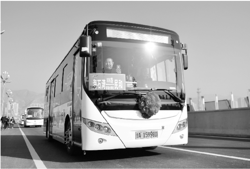
川海大桥正式开通

同时,自治区应急管理指挥部组织交通海事部门拆除了 2 座浮桥以及 1 座施工栈桥,停运了京星等渡口;督促中卫市两座在建大桥修编了防凌应急抢险预案,落实了防御措施。宁夏沿黄各乡镇加强重点河段、重点工程巡堤查险工作,防范入黄主要干沟水位上涨倒灌。