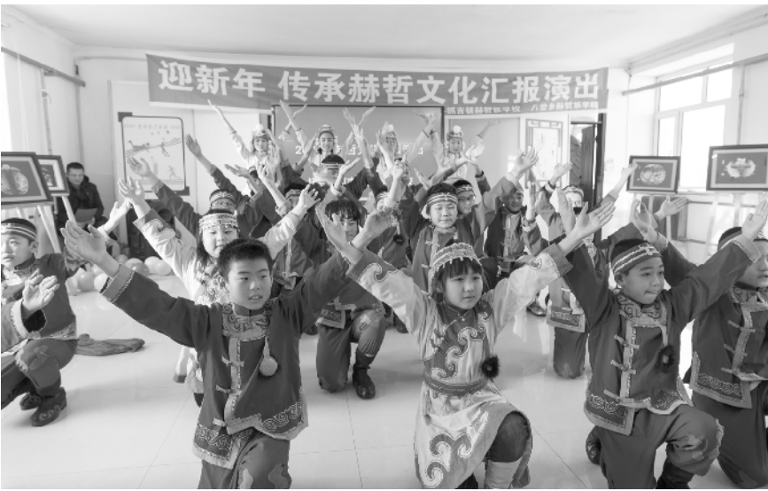
赫哲族学校:传承赫哲族文化

抓吉镇赫哲族学校的学生在为元旦文艺演出排练(2019 年 12 月 30 日报)。抓吉镇赫哲族学校位于黑龙江省抚远市抓吉镇,学校地处赫哲族聚居区,现有九个年级 33 名学生。2016 年,抓吉镇赫哲族学校正式将传承发扬赫哲族文化列为特色办学项目。学生从二年级开始学习赫哲族语言,三年级开始学习赫哲族舞蹈、手工制作鱼皮画,学校体育课还设置了“顶杠”“鱼王角力”等活动,让孩子们体验、传承赫哲族文化。