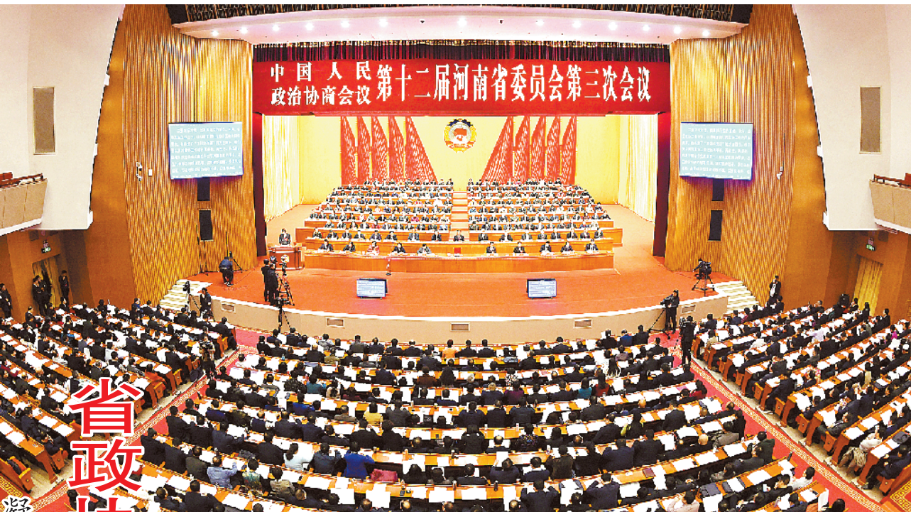
1月8日下午,中国人民政治协商会议第十二届河南省委员会第三次会议在省人民会堂开幕。

习近平强调,不忘初心、牢记使命,必须以正视问题的勇气和刀刃向内的自觉不断推进党的自我革命。敢于直面问题、勇于修正错误,是我们党的显著特点和优势。强大的政党是在自我革命中锻造出来的。全党必须始终保持崇高的革命理想和旺盛的革命斗志,用好批评和自我批评这个锐利武器,驰而不息抓好正风肃纪反腐,不断增强党自我净化、自我完善、自我革新、自我提高的能力,把我们党建设得更加坚强有力。(下转第二版)