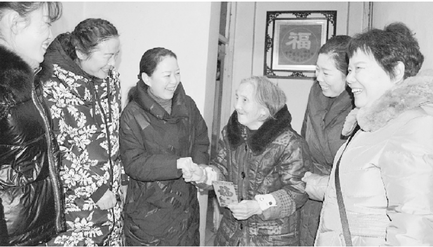
春节来临之际,周口实验幼儿园开展了走访慰问活动,园领导班子一行走访慰问了该园退休职工、困难职工等,并送上了慰问品和新春祝福。