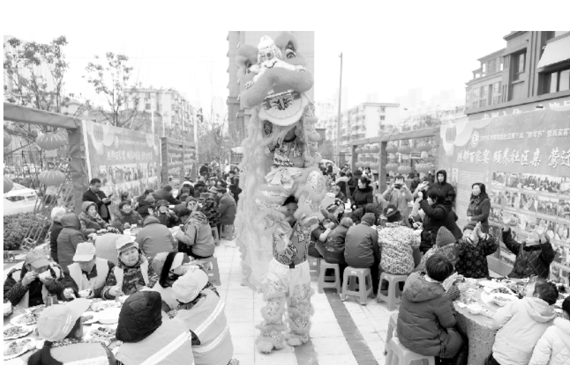
合肥：百家宴 迎新春 1月15日，金寨南路社区居民和环卫工人在百家宴上品美食，观看表演。当日，安徽省合肥市常青街道金寨南路社区举办“百家宴迎新春”活动，邀请社区老人及环卫工人欢聚一堂，喜迎新春佳节。

新华社北京1月15日电(记者 余俊杰)记者15日从中央广播电视总台获悉，2020年春节联欢晚会第一次彩排已于日前顺利完成。据介绍，今年春晚语言类节目亮点纷呈，以体现社会责任与担当作为创作主旨，聚焦反映新时代风采。 据介绍，今年春晚语言类节目深度反映社会现实、展现百姓生活，同时兼顾节目艺术水准，让观众在潜移默化中受到感染与熏陶——有的节目反映优质服务让生活更美好；有的瞄准职场焦虑带来的生活困境；有的揭示互助互爱是和谐社会的幸福密码；有的则鞭挞形式主义、官僚主义等不正之风。 据悉，春晚戏曲类和魔杂类节目亦有新突破，兼顾了艺术性与流行性， 将一流团队、一流技艺、一流包装相融合，实现对传统文化的时代表达。 今年春晚延续主会场+分会场的舞台设置，北京主会场联动河南郑州分会场、粤港澳大湾区分会场共同呈现一场“盛世大联欢”。 据了解，今年春晚在舞台方面还首次打造三层立体舞美，同时运用飞屏技术营造出360度环绕式景观，通过精良制作，让观众在屏幕前就能有“裸眼3D”的极致体验。此外，依托5G+8K/4K/VR等创新科技手段，主创团队打造了一个融合地面、空中、海面的立体空间图景，还将制作8K版春晚。 春晚舞台还将首次融入“快闪”概念，打破舞台界限，提升观众参与感，共同营造出喜乐祥和的春节氛围。