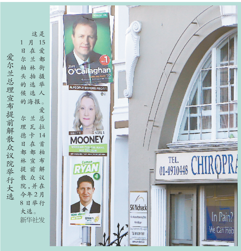
这是15日爱都柏林街头拍摄到的爱都柏林选区候选人海报。爱尔兰总理瓦拉赫在都柏林宣布解散众议院,并于2月8日举行大选。