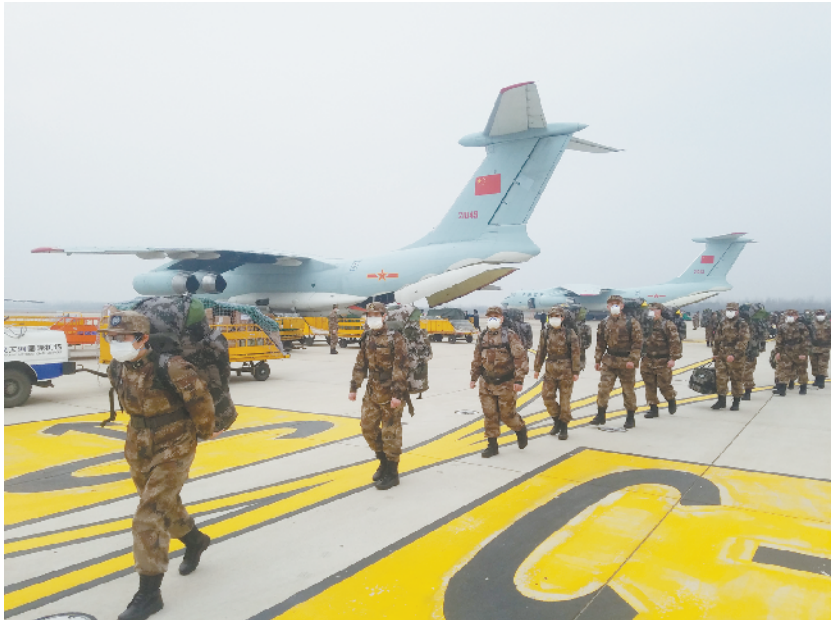
空军8架飞机紧急空运军队支援湖北医疗队抵达武汉

目前深圳市第三人民医院研究人员正在做进一步分离病毒的研究。提醒广大市民，戴口罩的同时，要勤洗手，注意个人卫生。