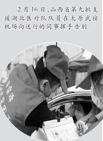
2月15日,在常德市武陵区穿紫河街道,志愿者给进入小区的居民测量体温。

上海静安区委依托高铁站,会同上海铁路局党委、市交通委党组、铁路上海站地区管委会办公室党组等,以党建为纽带成立联合指挥中心,组建以党员为主体的高铁防控志愿者队伍,共同做好进沪人员的体温检测、宣传告知、信息登记,加强大客流疏导中的疫情防控工作。