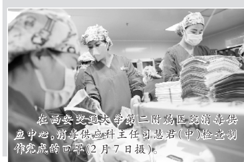
疫情防控各项工作中。

各地各有关部门针对疫情需要,在防控第一线和关键部位及时建立党组织,选好配强党组织负责人,发挥党组织在疫情防控阻击战中的核心引领作用,把广大党员和职工群众迅速聚拢在党的旗帜下。