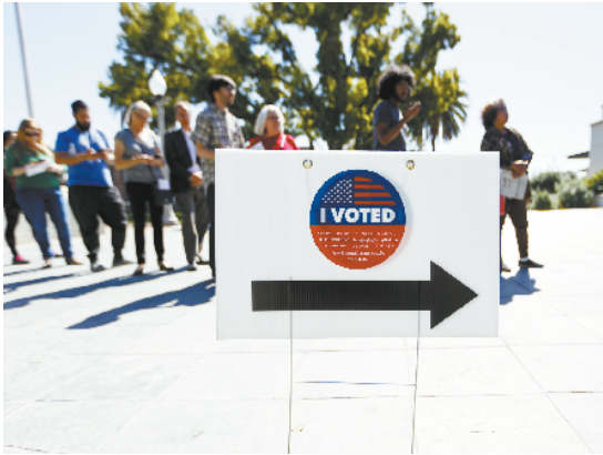
美国总统选举预选 迎来“超级星期二” 3月3日,选民在美国加利福尼亚州一个投票站外排队等待投票。 美国总统选举预选3日迎来重要节点“超级星期二”。

了应对难度,唯一能做的就是阻断传播。”雅克说,中国“做到了这一点”。 他表示,疫情暴发后,中国政府应对有力,采取措施非常有效,新增病例数连续下降就是最好的证明。 “一些西方国家对中国抗击疫情曾经进行各种抨击,这非常荒谬。”他说,“事实证明了中国抗疫成效,他们应该好好向中国学习经验”。