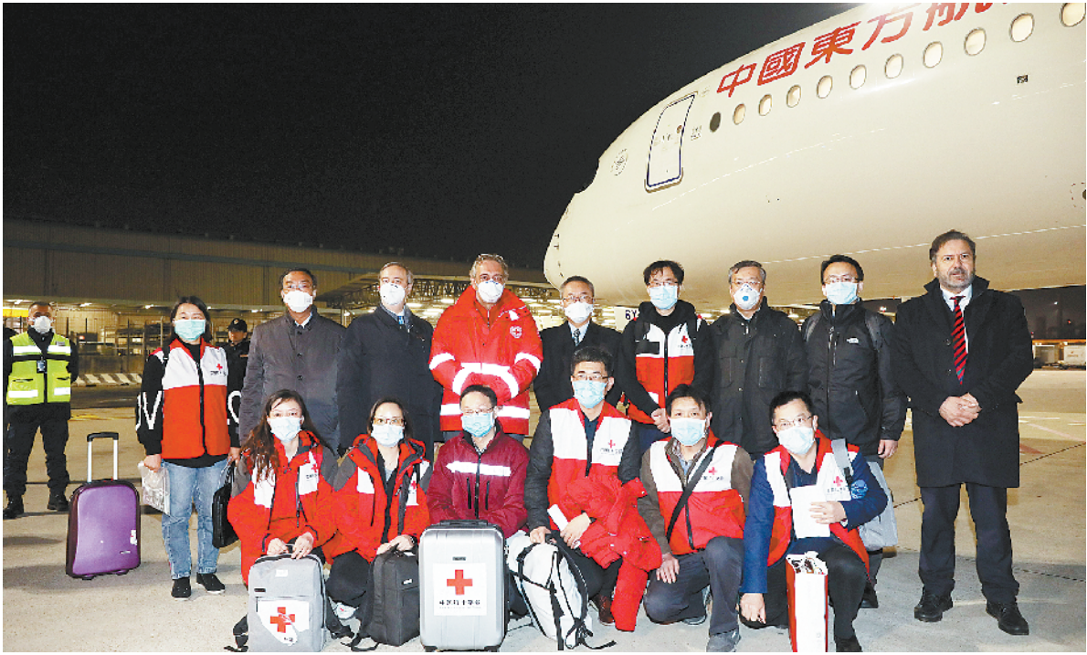
3月12日，在意大利首都罗马，意大利红十字会主席罗卡(后排右六)与中国抗疫医疗专家组一行9人合影。 当地时间12日晚，由国家卫生健康委员会和中国红十字会共同组建的抗疫医疗专家组一行9人抵达意大利首都罗马，并带来部分中方捐助的医疗物资。