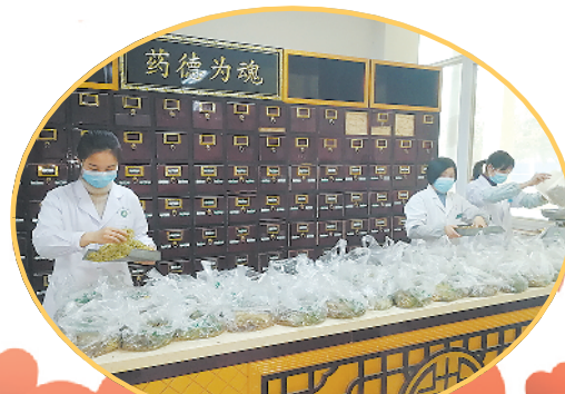
西华县中医院发挥中医药优势为疫情防控一线人员配制中药汤剂