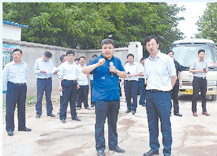
西华县委书记林鸿嘉、县长田庆杰到县中医院调研

中医文化源远流长、博大精深,汇聚了华夏数千年文化之精髓,为中华民族的繁衍生息做出了不可磨灭的贡献,也成为中国奉献给世界文明最珍贵的一块瑰宝。