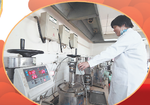
医生正在熬制中药