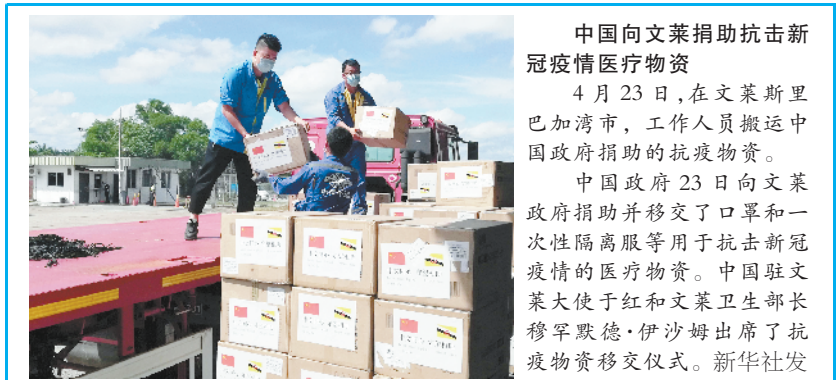
中国向文莱捐助抗击新冠肺炎疫情医疗物资

4月23日,在文莱斯里巴加湾市,工作人员搬运中国政府捐助的抗疫物资。中国政府23日向文莱政府捐助并移交了口罩和一次性隔离服等用于抗击新冠肺炎疫情的医疗物资。中国驻文莱大使于红和文莱卫生部长穆罕默德·伊沙姆出席了抗疫物资移交仪式。