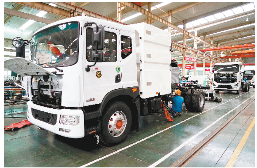
河南长葛:复工复产按下“加速键”

中国航天日至今已举办四届,搭建了普及航天知识、激励科学探索、培植创新文化的平台,成为公众和世界了解中国航天的一个窗口。