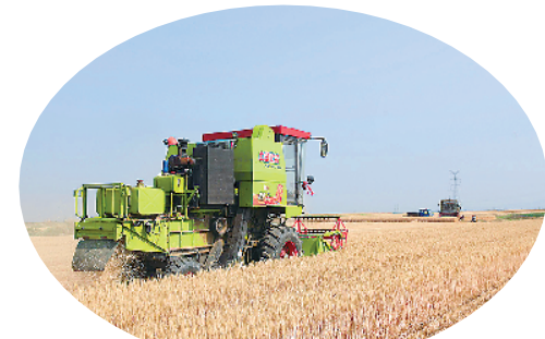
163万亩农田粮食生产实现14连增。