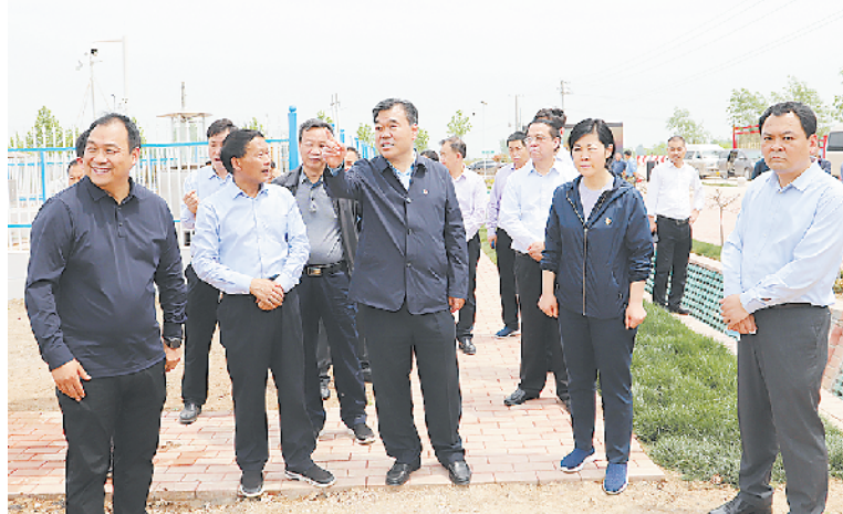
2020年4月30日,周口市委书记刘继标带队到郸城县调研观摩高标准农田建设工作。刘继标对郸城县高标准农田建设成效给予充分肯定,并要求建好、用好、管护好,让农民群众长期受益,为粮食安全做出更大的贡献。