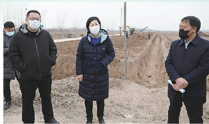
市人大常委会党组成员、郸城县委书记罗文阁调研指导高标准农田建设。