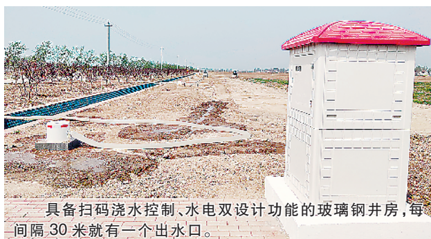
具备扫码浇水控制、水电双设计功能的玻璃钢井房,每间隔30米就有一个出水口。