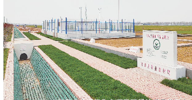
高标准农田胡集乡项目区耕地质量监测点。