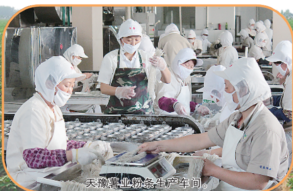
天豫薯业淀粉生产车间。