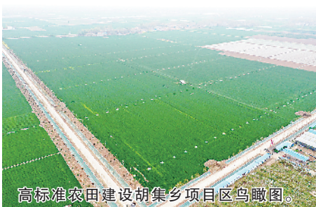
高标准农田建设胡集乡项目区鸟瞰图。