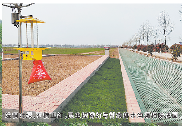
法桐吐绿,石榴正红,昆虫控诱灯与作物排水沟渠相映成画。