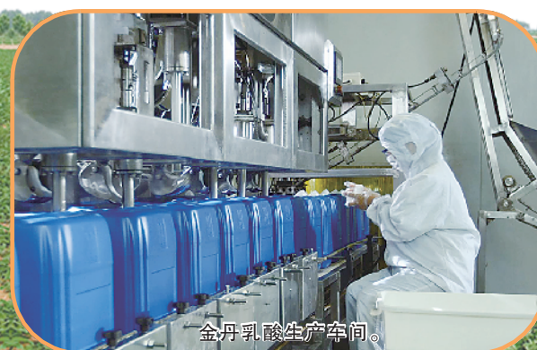
金丹乳酸生产车间。