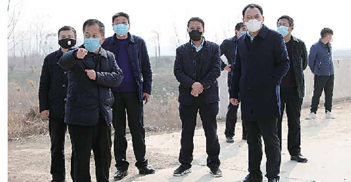
郸城县长李全林调研指导高标准农田建设。