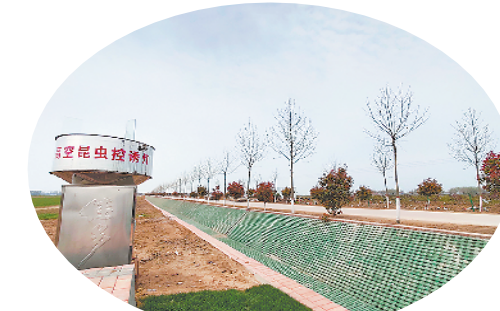
高标准农田高空昆虫控诱灯。