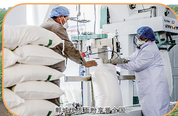
郸城优质面粉享誉全国。