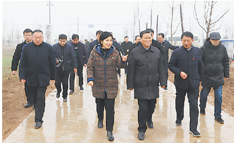
2019年12月25日,副省长武国定在郸城县调研指导高标准农田建设工作。