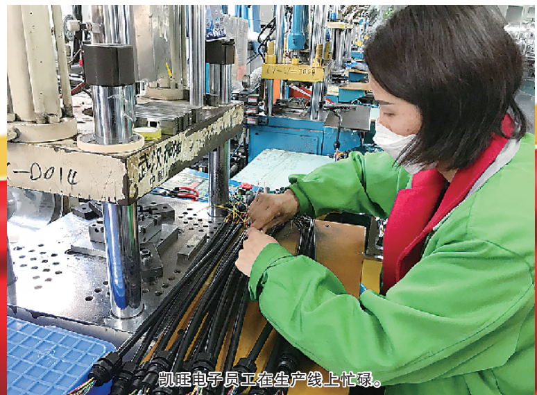
凯旺电子员工在生产线上作业。