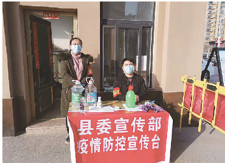
县直单位下沉至城区各小区义务值守。