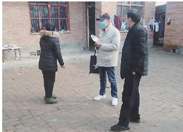
乡镇干部入户排查宣传。