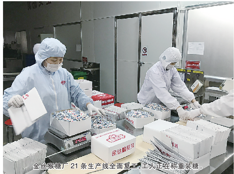
金丝猴牌21条生产线全面复工复产工人在检修机器。