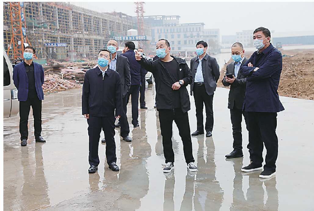
县委书记皇甫立新视察重点项目复工情况。