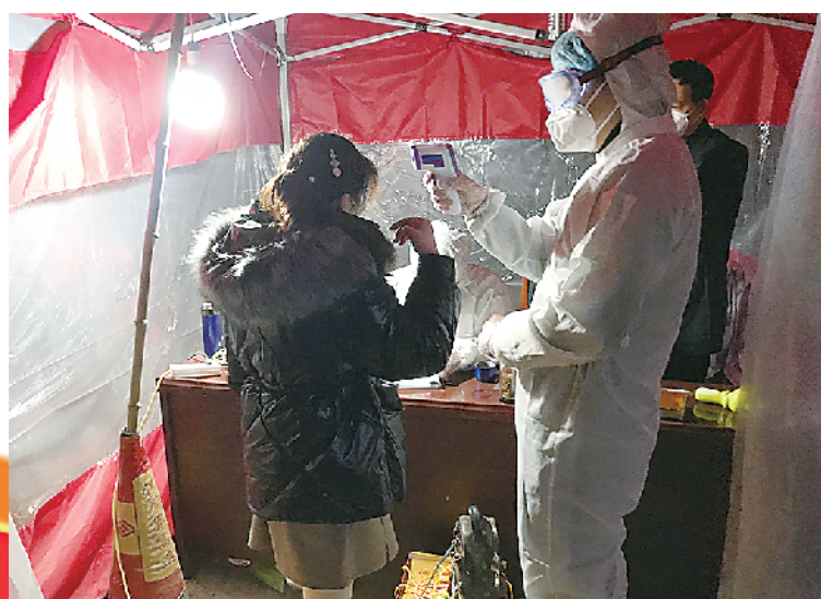
返乡人员接受身体检查并登记。