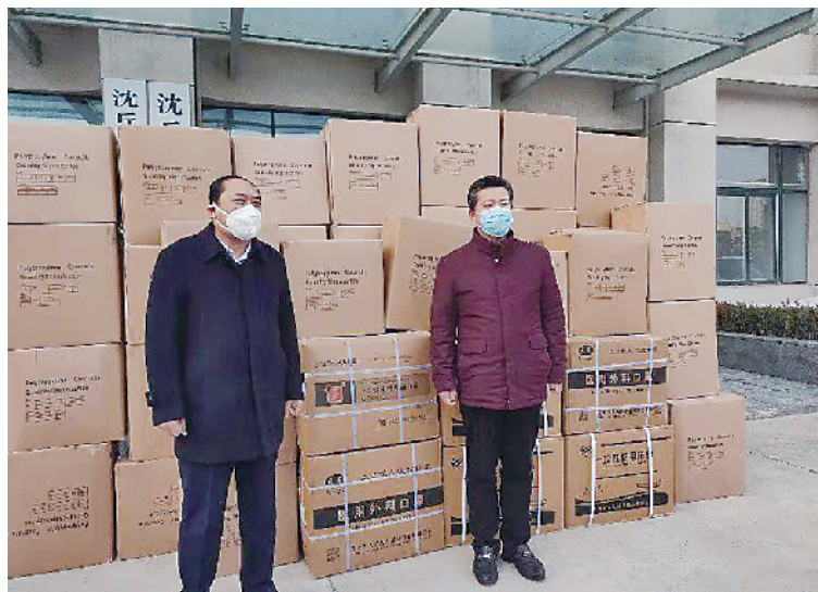
爱心企业纷纷捐赠医疗物资。