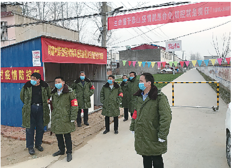
各行政村设立卡点严防死守。