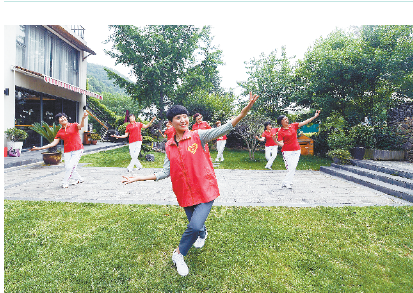
乡村“妇女微家”举办母亲节主题活动

5月8日,在长兴县小浦镇潘礼南村的“妇女微家”中,志愿者(中)教村里的妈妈们学习舞蹈动作。