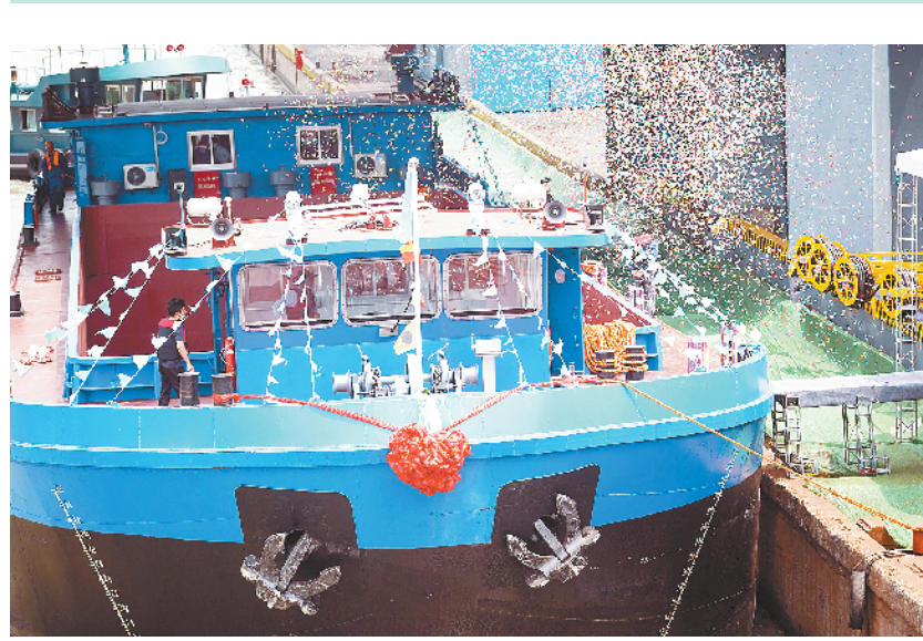
长江流域首艘千吨级纯电动货船在江苏常州试航

新一代载人飞船是面向我国载人月球探测、空间站运营等任务需求而论证的具有国际先进水平的新一代天地往返运输飞行器,具备高安全、高可靠、模块化、多任务、可重复使用等特点,可提高我国载人飞船的乘员人数和货物运输能力。试验船采用返回舱与服务舱两舱构型,通过配置不同的服务舱模块来适应近地空间和月球探测任务。