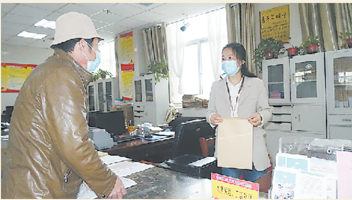
群众在大病报补城乡一体化示范区服务窗口向工作人员咨询业务办理流程。