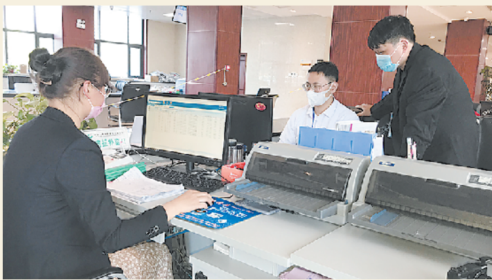
大病报补西华服务窗口工作人员通过线上核实一名群众城乡居民大病报补业务的手续。