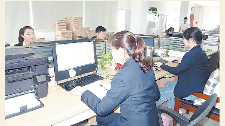
新冠肺炎疫情期间，我市城乡居民大病保险业务没有按下“暂停键”，中国人寿周口分公司健康保险部的“云服务”，将触角精准伸向每一位符合条件的群众，群众足不出户就能办理业务，第一时间领到补偿款，享受城乡居民大病保险这一惠民政策带来的红利。图为健康保险部“云服务”一角。

一个个被大病击倒而又重新站起来的城乡居民，一个个被大病击垮而又重新修复的家庭，无声地向人们讲述着一个个城乡居民大病保险业务呵护群众生命健康的动人故事。