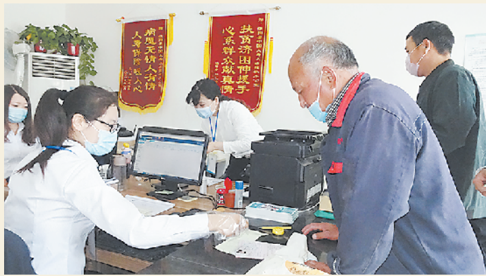
群众在大病报补淮阳服务窗口工作人员的指导下完善手续。