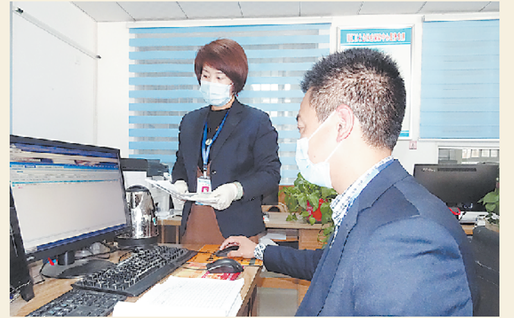
大病报补川汇区服务窗口工作人员通过“云服务”主动为群众办理大病报补业务。