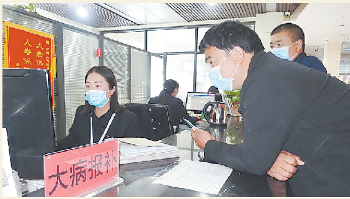
群众在大病报补沈丘服务窗口工作人员的帮助下办理大病报补业务。