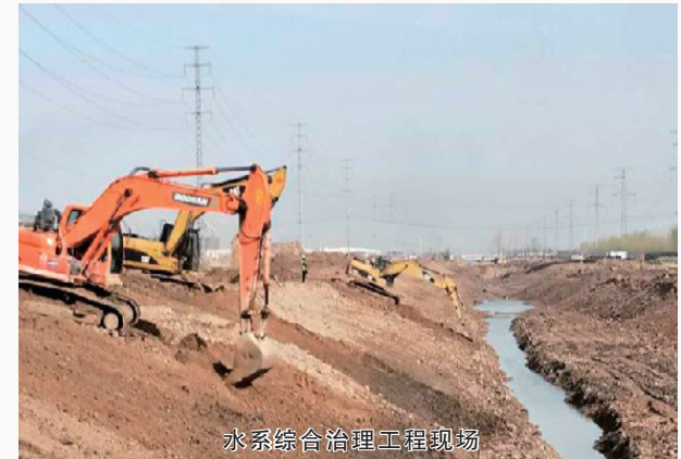
水系综合治理工程现场