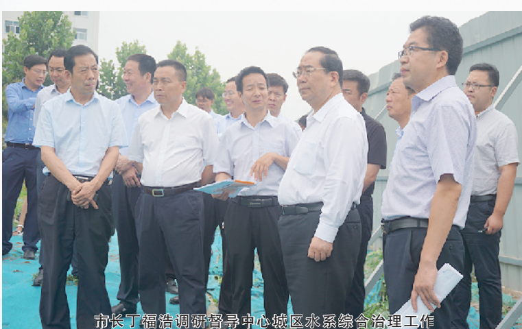
市长丁福浩调研中心城区水系综合治理工作