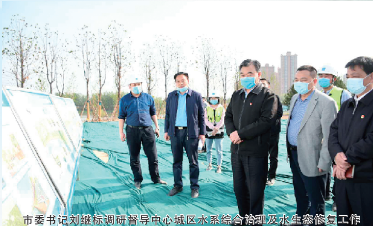
市委书记刘继标调研中心城区水系综合治理及水生态修复工作