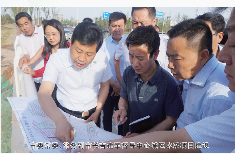
市委常委、常务副市长吉建军督导中心城区水系项目建设