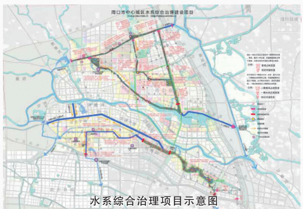
水系综合治理项目示意图