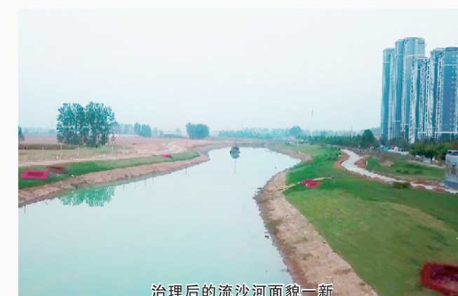
治理后的流沙河面貌一新