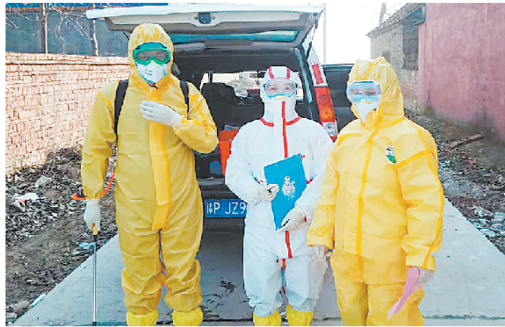
消杀队员在乡镇作业