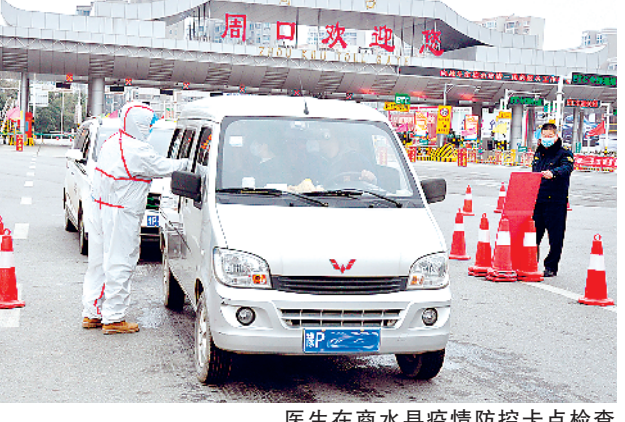
医生在商水县疫情防控卡点检查