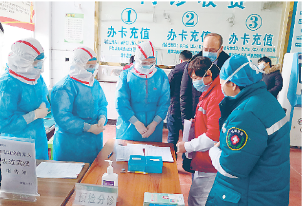
疫情期间,忙碌的预检分诊

2020年,注定让人铭记。记忆深刻的不仅有凶猛的疫情,还有那危难中挺身而出、英勇斗争的身影。 回顾这个春天,新冠肺炎疫情来势汹汹,恐慌在人们的心头笼罩了一层厚厚的阴云,距离“震中”武汉仅370公里的商水面临严峻考验。 这是一场没有硝烟的战争,是一场白衣天使担当阻击主角的战争。千斤重担,唯有勇挑。冲锋一线,舍我其谁! 疫情阻击战打响,商水县人民医院作为全县新冠肺炎患者定点救治医院,成为阻击疫情的前沿阵地。该院按照县委、县政府的部署,坚定信心、果断决策、不惜一切代价进行科学防治,全体医务人员第一时间集结到位,在这个没有硝烟的战场上,冲锋陷阵,逆行而上,口力同心战疫情。 截至目前,医院预检分诊已精确分诊13600余人;急诊科接送发热病人994人,急诊重症监护病房收治危重病人131余人,急诊门诊接诊普通患者4079余人,其中抢救急危重病人158余人;发热门诊就诊普通发热病人6057人,武汉返乡病人281人,武汉接触病人529人;感染性疾病科累积留观隔离发热患者103人,解除隔离103人。同时,医院取得院内“零感染、零死亡”的成绩,用英勇无畏的行动践行和诠释了“敬佑生命、救死扶伤、甘于奉献、大爱无疆”的新时代医疗卫生精神,为全县人民疫情防控交出一份满意答卷。