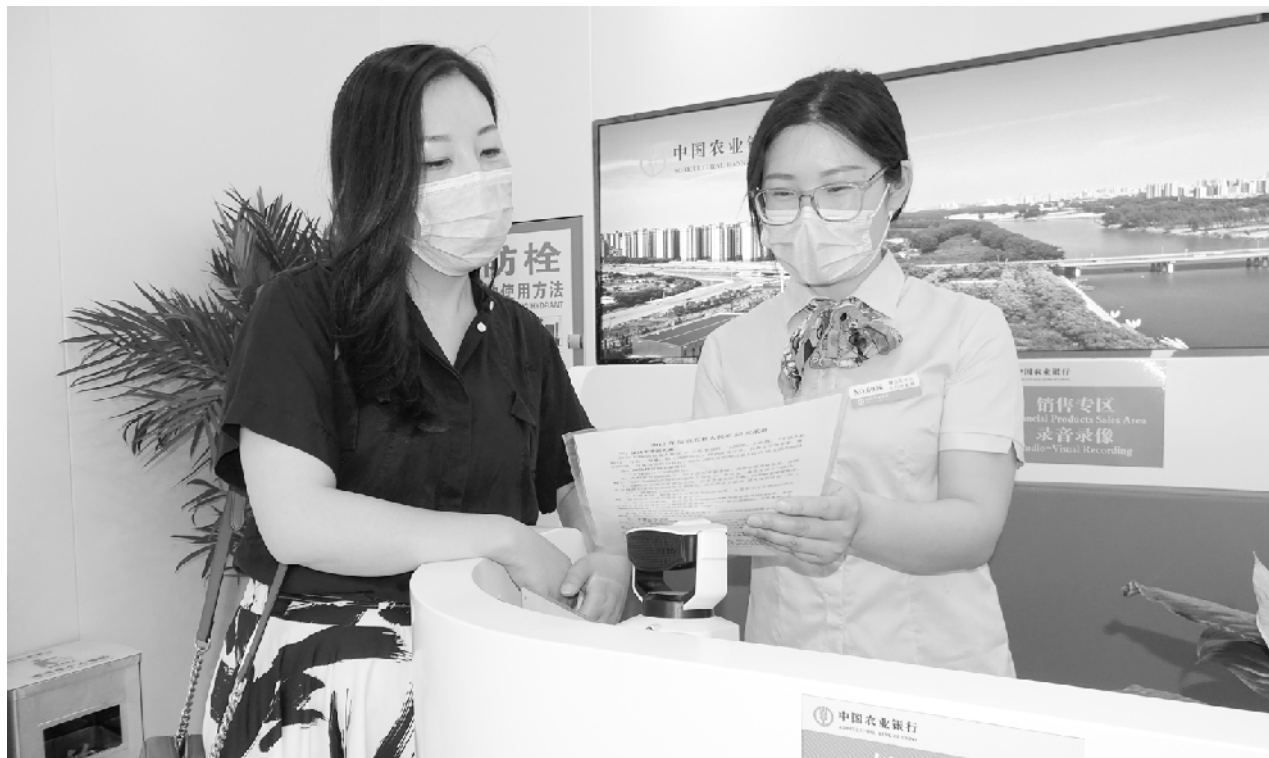
近日,农行周口分行工作人员积极向群众宣传金融知识,讲解理财的途径和方法,为客户普及金融基本知识,提升金融素养,珍爱自己的信用,展示了农行人积极向上的职业精神和农行为服务社会的良好企业形象。图为5月26日,农行周口分行营业部工作人员向客户介绍理财产品。

加速小微贷款投放,服务主流经济发展。新冠肺炎疫情发生后,许多中小微企业和个体工商户经营困难,该行主动对接有信贷需求的复工复产企业,通过简化手续、