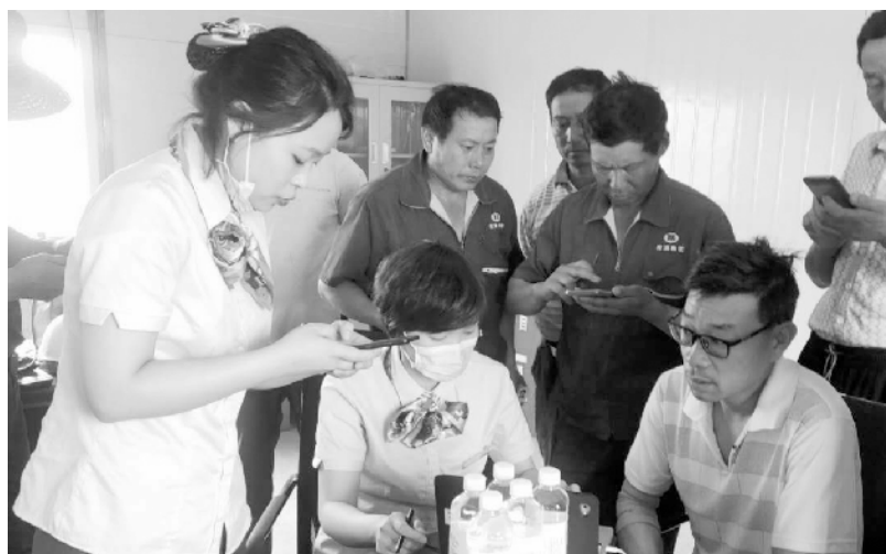
近日,农行周口分行积极落实市委、市政府关于农民工工资支付监管工作的要求,组织工作人员携带发卡机,到工地为农民工现场办理网上学银等,宣传金融知识。图为农行火车站分理处工作人员在某建筑工地现场为农民工办理农行卡。