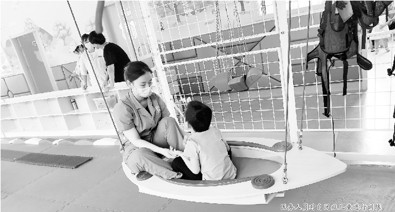
医务人员对自闭症儿童进行训练