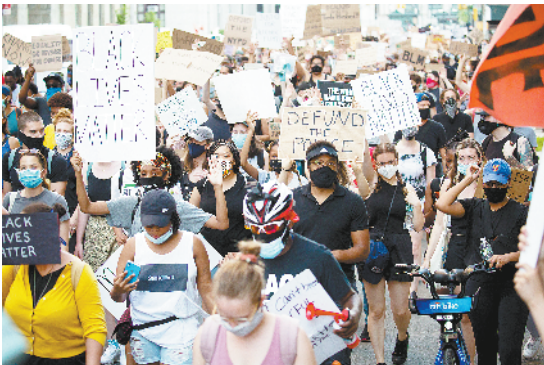
6 月 9 日,人们在美国纽约街头参加抗议活动。

长达 4 小时的葬礼结束后,弗洛伊德的遗体被运往休斯敦一处墓地安葬,长眠在其母亲身旁。在接近