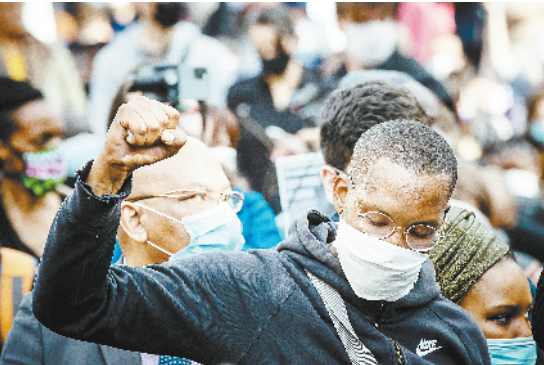
6 月 9 日,人们在法国巴黎共和国广场参加集会,悼念因警察暴力执法而死亡的非裔美国人弗洛伊德,抗议种族歧视和警察暴力执法。

墓地时,金色灵柩被放置在一辆马车上进入墓园,以此特殊方式表达对他的纪念。从灵柩启程直到墓地,