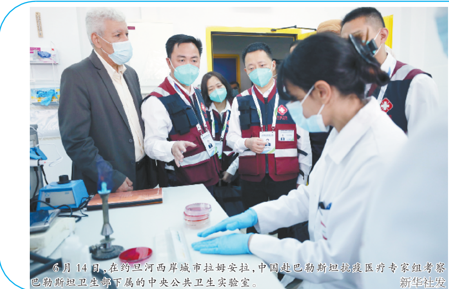
6 月 14 日，在约旦河西岸城市拉姆安拉，中国赴巴勒斯坦抗疫医疗专家组考察巴勒斯坦卫生部下属的中央公共卫生实验室。

新华社拉姆安拉 6 月 14 日电 中国赴巴勒斯坦抗疫医疗专家组 14 日在约旦河西岸城市拉姆安拉继续进行考察，并与相关机构医疗专家就新冠检测和治疗方法进行交流。 当天，专家组考察了巴勒斯坦卫生部下属的中央公共卫生实验室，听取巴方专家有关新冠病毒最新检测技术的介绍。专家组还与巴卫生部流行病学委员会、实验室团队、诊疗委员会、重症监护团队举行平行会议，探讨新冠肺炎流行病学调查方法、病毒检测技术、诊疗方案、重症救治经验等。 当天，专家组还考察了拉姆安