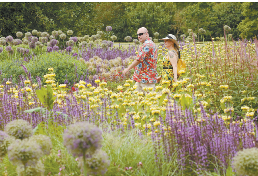
伦敦邱园重新开门迎客 6 月 14 日，游客在英国伦敦邱园(英国皇家植物园)内赏花。 受新冠疫情影响而关闭的英国伦敦邱园(英国皇家植物园)近日重新开放户外区域，园内温室仍然关闭。园方严格限制客流，只接受提前预约的游客参观游览。 英国伦敦邱园(英国皇家植物园)建于 1759 年，2003 年被联合国教科文组织列为“世界文化遗产”。

新华社阿克拉 6 月 14 日电（记者许正 郭骏）阿布贾消息：尼日利亚军方 14 日发表声明称，极端组织“博科圣地”武装分子 13 日袭击了尼东北部博尔诺州一处村庄，军方在交火中打死 20 名武装分子。 声明说，尼日利亚军方在行动中还俘获数名武装分子，捣毁四辆炮车并缴获部分武器装备。 13 日，“博科圣地”武装分子还袭击了博尔诺州另外两处村庄。军方消息人士说，袭击造成多名平民和士兵伤亡。 “博科圣地”成立十余年来，频繁出没于尼日利亚东北部，并对周边的乍得、尼日尔、喀麦隆等国构成安全威胁。本月 9 日，“博科圣地”武装分子袭击博尔诺州一处村庄，杀害数十名平民。