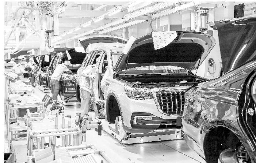
红旗品牌汽车上半年累计销量突破70000辆 在位于吉林长春的红旗工厂总装车间,工人在装配车辆(6月19日摄)。记者从中国第一汽车集团有限公司获悉,该公司旗下红旗品牌汽车今年1-6月累计销量突破70000辆,同比增长111%,6月销量突破15400辆,同比增长92%,继续保持逆势上扬态势。

香港特区国安委的职责为:分析研判香港特别行政区维护国家安全形势,规划有关工作,制定香港特别行政区维护国家安全的法律制度和执行机制的建设;协调香港特别行政区维护国家安全的重点工作和重大行动。