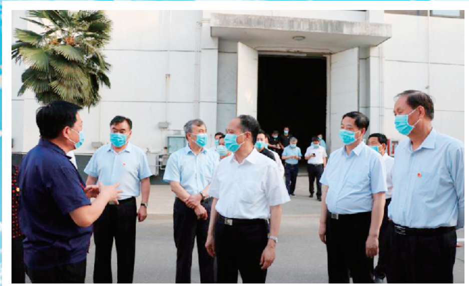
全国人大常委会副委员长吉炳轩到东郊国家粮食储备库调研,市委书记刘继标等参加调研