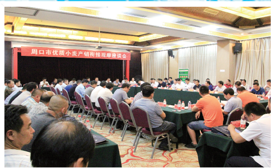
优质小麦产销衔接观摩座谈会现场

又是一年丰收时。 今年是决战脱贫攻坚收官之年,全面建成小康社会的决胜之年,在疫情防控形势依然严峻的大背景下,全市粮食和物资储备部门,一手抓疫情防控,一手抓粮食流通,粮食购销工作开展顺利。截至目前,全市已累计收购夏粮新粮62.1万吨,优质小麦收购3.8万吨,平均收购价1.12元/斤。全市累计销售粮食287万吨,其中商品粮累计销售226万吨,最低收购价累计销售61万吨。目前,全市库存粮食百