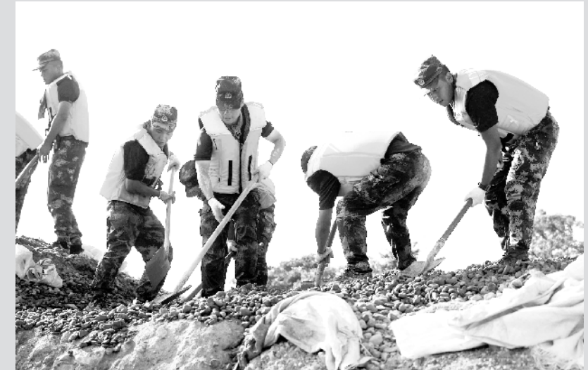
泥水中的抗洪战士

武警江西总队上饶支队的官兵在处置一处堤坝坍塌险情(7 月 14 日摄)。 开挖导渗沟、填埋沙石、疏通排水渠、垒填沙袋,汗水划过脸颊,浸湿军装。在位于江西省余干县古埠镇的齐墩圩上,武警江西总队上饶支队的 60 名战士头顶烈日,挥汗如雨,在泥水中处置一处堤坝坍塌险情。在这群平均年龄只有 21 岁的年轻战士中,最小的只有 18 岁,其中“00”后战士就有 27 人。在汗水与泥水的交织中,记者用镜头记录下这些最可爱的身影。