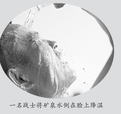
一名战士将矿泉水倒在脸上降温