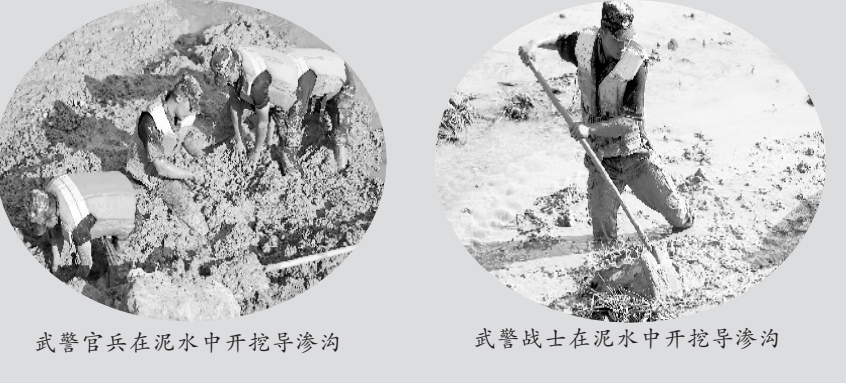
武警官兵在泥水中开挖导渗沟