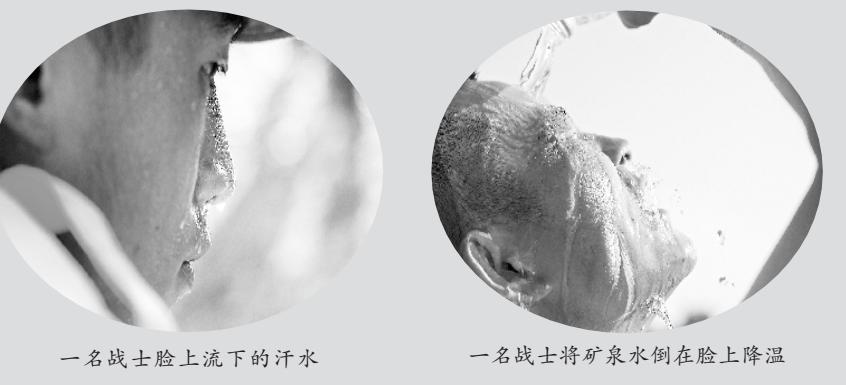
一名战士脸上流下的汗水