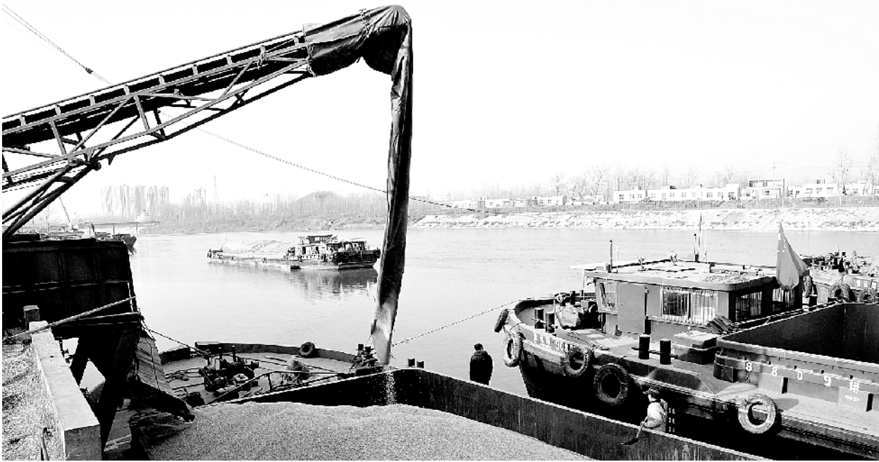
2010 年,周口内河航运粮食运输。

■1月1日,周口市贾鲁河大桥正式竣工通车。 ■1月10日,淮阳龙湖被国家林业局命名为国家湿地公园。 ■5月25日,在第九届中国艺术节上,周口市周末一元剧场荣获全国社会文化艺术最高奖——群星奖。 ■7月2日,市区沙颍河大庆路大桥工程和周口大道改扩建工程同时竣工通车。 ■8月18日,周口撤地设市10周年庆祝大会在市体育馆举行。省、市领导及各级干部、群众代表4000多人参加庆祝大会。 ■沙颍河周口港首迎7000余吨拖队。5月21日,周口港迎来河南内河航运30多年来首批拖队,总载重7000多吨的驳船拖队顺利驶入周口港。大规模拖队驶入周口港,在河南航运史上尚属首次,标志着沙颍河具备了长年通航万吨航船的能力。随后,河南省的煤炭、粮食多次经周口港中心港区运往华东地区,下游的矿石经水路运抵周口并在中心港区顺利中转,沙颍河航运进入新的发展时期。 ■产业集聚区建设加快。我市集中土地资金、环境容量等资源优先保证产业集聚区建设,支持产业集聚区基