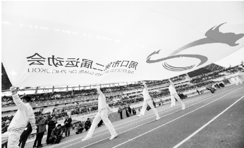
2012 年,周口市第二届运动会开幕式场景。