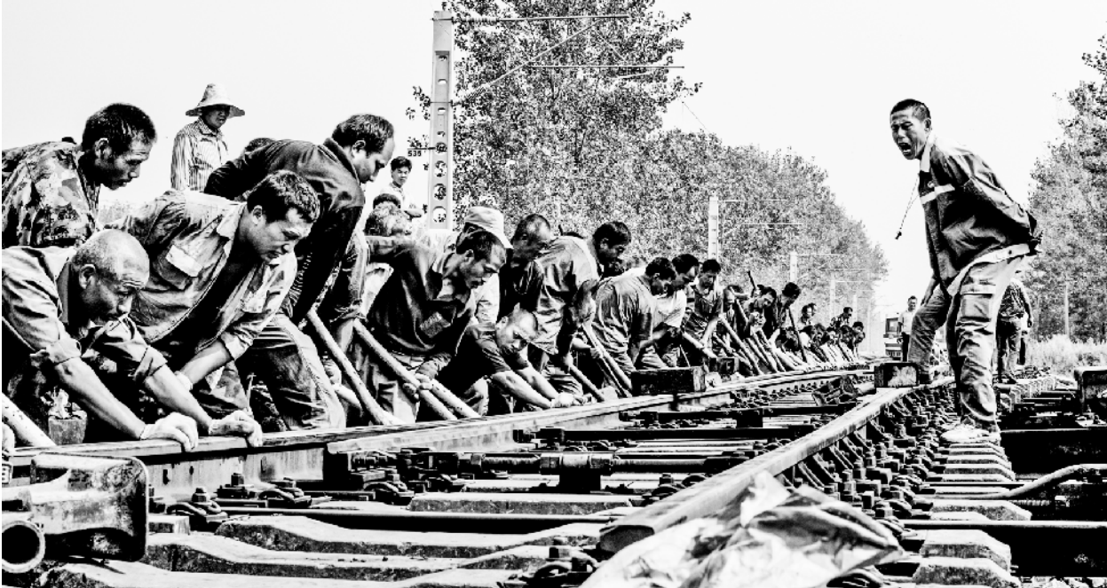
2011 年 11 月,漯阜复线电气化改造工程建设中。

■恒大集团向周口市政府无偿捐赠恒大中学。4月27日,广东省河南商会会长、恒大集团董事局主席许家印,将价值上亿元的恒大中学无偿捐赠给周口市政府。恒大中学是恒大集团于2000年斥资1亿元在周口市创办的一所民办学校。该校投资金额大、建设标准高,有效扩充了周口市优质教育资源。办学10余年间,该校管理水平和教育质量不断提高,累计培养学生2万多名。 ■沙颍河周口至漯河段航运开发工程开工奠基。12月30日,沙颍河周口至漯河段航运开发工程开工奠基仪式在周口市举行。该工程主要建设内容是:建设周口港至漯河港83.9公里四级航道,沿河规划建设周口船闸葫芦湾通航枢纽、大路李通航枢纽,建设漯河港、周口港、西华港区、商水港区,建设500吨级泊位16个,设计吞吐能力405万吨,工程总投资17.5亿元,建设工期4年。周口船闸是该工程首期建设项目。 ■2011年,全市新引进制鞋项目10个,总投资13.5亿元。截至年底,全市共落户制鞋企业30家,拥有成品鞋生产线21条,年产鞋1550万双,年产值15亿元,安排就业人员4万人,初步