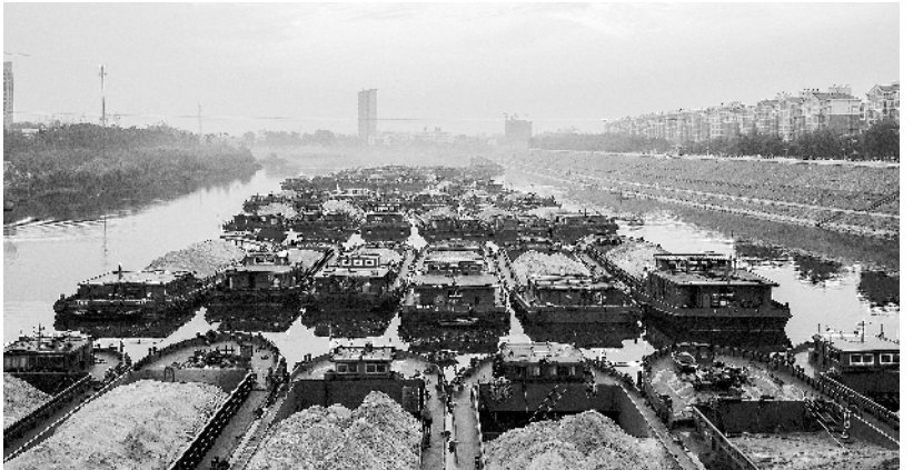
2014 年,周口航运船整装待发。

1.5万亩,总投资20亿元,建设工期5年。项目一期工程占地1170亩,投资5亿元,建有航展大楼、航展大厅、机场综合楼、跑道、机库、维修中心等设施。 ■9月10日,在中央电视台“寻找最美乡村教师”颁奖典礼上,周口市郸城县秋渠中学教师张伟被授予最美乡村教师称号。 ■9月29日,河南省第十二届运动会暨全民健身大会闭幕式在焦作举行。闭幕式上,市长刘继标接过省运会会旗,标志着周口市正式成为2018年河南省第十三届运动会的承办城市。 ■12月5日,八一路实现南北贯通。 ■12月16日,央视《新闻联播》头条聚焦太康爱心粥屋。 ■2014年,中心城区12条主干道实行机械化清扫,中心城区实现道路保洁机械化。②3