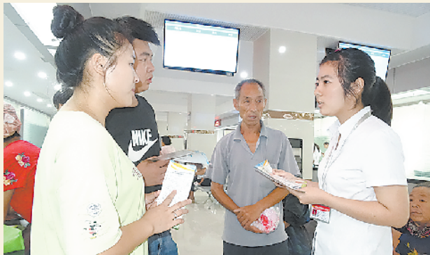
群众在大病报销商水服务窗口前向工作人员咨询业务流程。