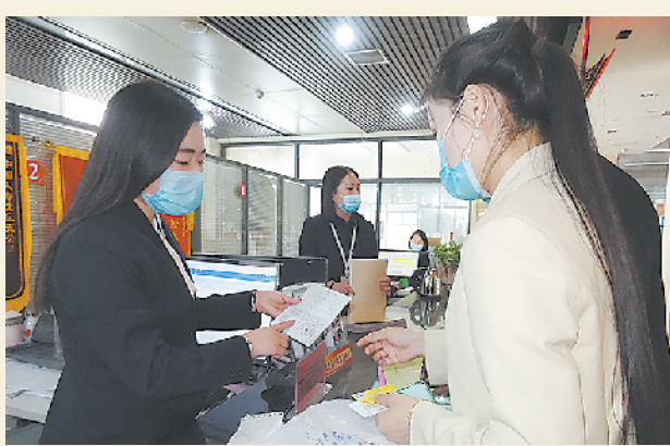
群众在大病报销沈丘服务窗口向工作人员咨询如何办理大病二次报销业务。