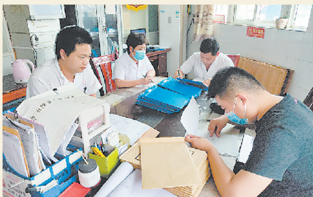
大病报销项城工作人员正在审核一名群众提供的大病保险业务信息。