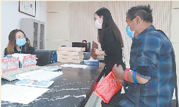
群众在大病报销郸城服务窗口前向工作人员申请大病报销业务。