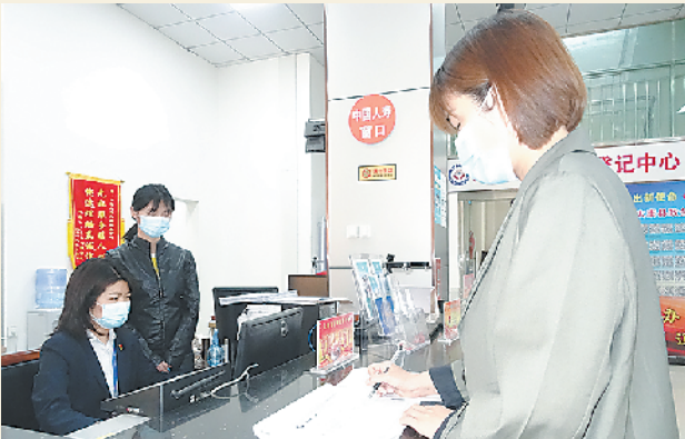
群众在大病报销太康服务窗口工作人员的指导下办理业务。