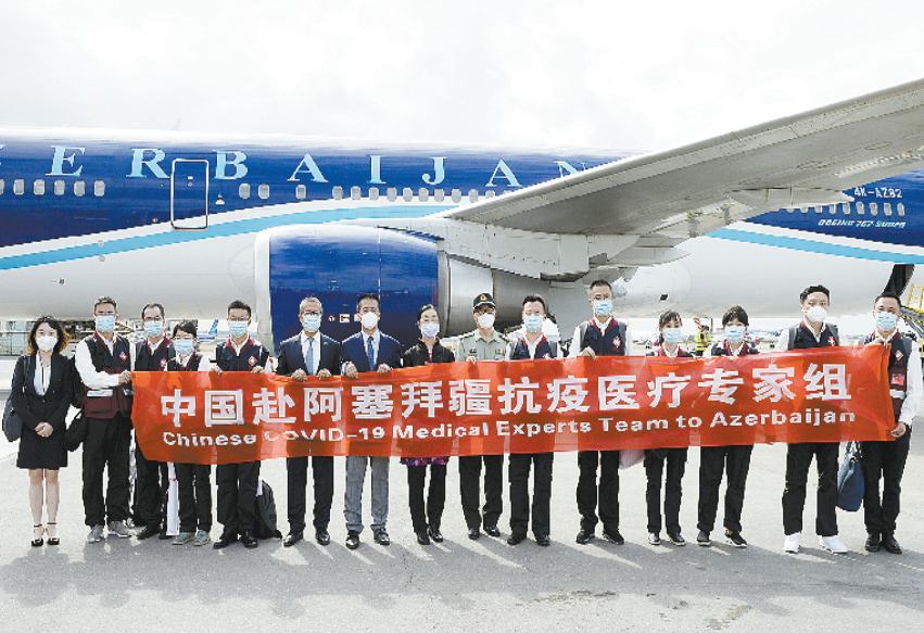
8月4日,中国赴阿塞拜疆抗疫医疗专家组抵达阿塞拜疆首都巴库。

新华社第比利斯8月4日电 (记者李铭)巴库消息:中国赴阿塞拜疆抗疫医疗专家组4日抵达阿首都巴库,应阿塞拜疆政府邀请为当地新冠疫情防控提供支持。