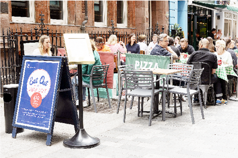
英国实施“就餐即帮忙”计划

8月4日,人们在英国伦敦一家餐厅的户外区域就餐。英国3日实施“就餐即帮忙”计划,以救助受新冠疫情冲击严重的酒吧、餐厅和咖啡馆。这项优惠计划规定,民众在8月3日至8月31日期间的周一至周三外出就餐时,酒精饮料以外的餐费可半价,每人最高优惠10英镑。