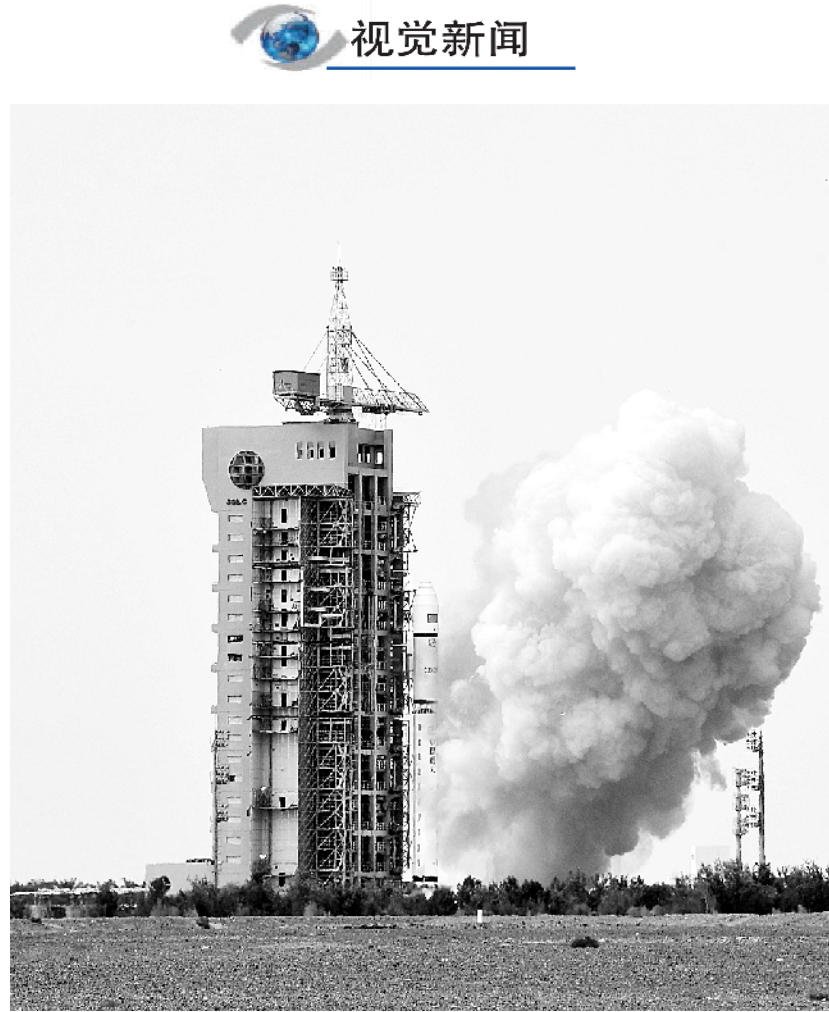
我国成功发射高分九号04星 搭载发射清华科学卫星