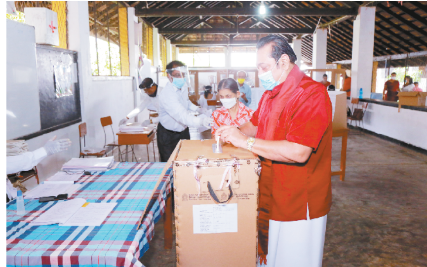
斯里兰卡议会选举顺利举行 8月5日,在斯里兰卡南部城市汉班托塔,斯里兰卡总理马欣达·拉贾帕克萨在投票站投票。因新冠疫情被迫两度推迟的斯里兰卡议会选举5日顺利举行,1100多万选民严格遵守防疫规定在全国22个选区参加投票。

个目标分别为美军RC-135战略侦察机和P-8A“海神”巡逻机。消息说,俄罗斯战机在飞行过程中始终遵守国际空域使用规则。据俄罗斯媒体报道,这是近8天来俄战机第5次在黑海上空拦截美军侦察机。本月4日,俄战机在巴伦支海中立水域上空拦截了一架挪威侦察机。