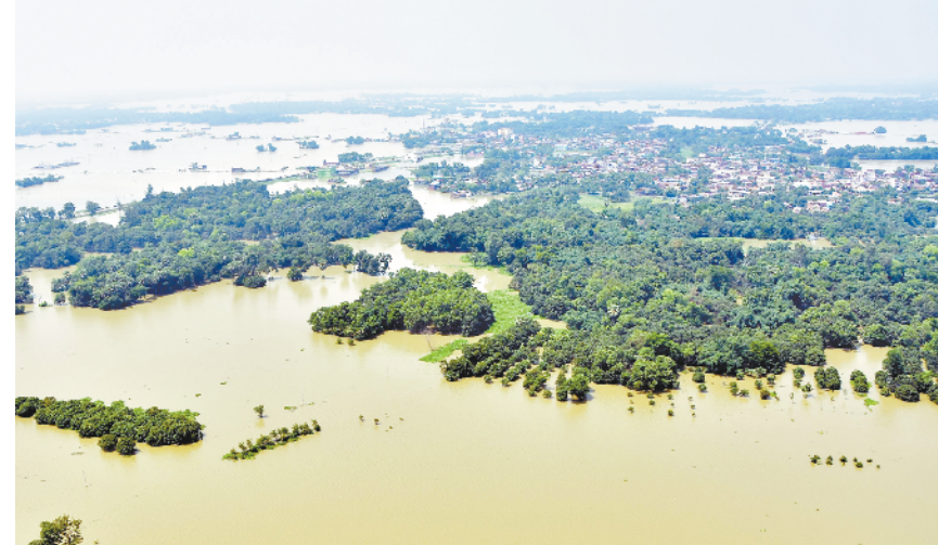
印度比哈尔邦洪水泛滥 这是8月5日航拍的印度比哈尔邦达尔彭加地区洪水泛滥景象。据印度比哈尔邦灾害管理部门通报,截至4日,比哈尔邦已有636万人受灾。

此前美国财政部主要依靠发行短期国债融资,以支持联邦政府应对新冠疫情。据摩根大通数据显示,美国国债的平均到期期限已降至2011年以来的最低水平。美国财政部预计未来几个季度的借款需求会有所缓和,但仍将处于历史较高水平。财政部预计今年第三季度将发债9470亿美元,低于第二季度实际发行的2.75万亿美元。第三季度最终发债额度将取决于国会就新一轮财政援助方案的谈判情况。