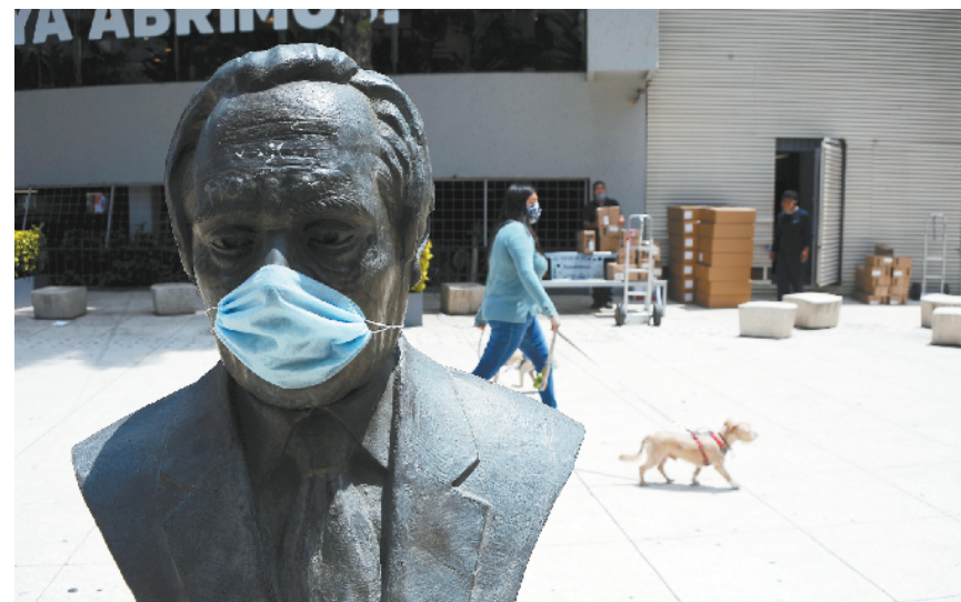
墨西哥新冠确诊病例突破45万例 8月5日,墨西哥首都墨西哥城的一个塑像被戴上了口罩。根据墨西哥卫生部5日晚公布的新冠疫情数据,过去24小时新增确诊病例6139例,累计确诊病例456100例。

佩戴口罩。鉴于澳大利亚部分地区疫情恶化以及澳新两国间的人员流动,新西兰卫生部已多次警告,新冠疫情或可二次暴发。希普金表示,目前新西兰还没发现新的社区传播,“建议佩戴口罩”是希望公众对病毒保持足够警惕。6月8日新西兰确诊病例一度清零以来,该国总体疫情控制状况平稳,但近两个月时有报告输入性病例。