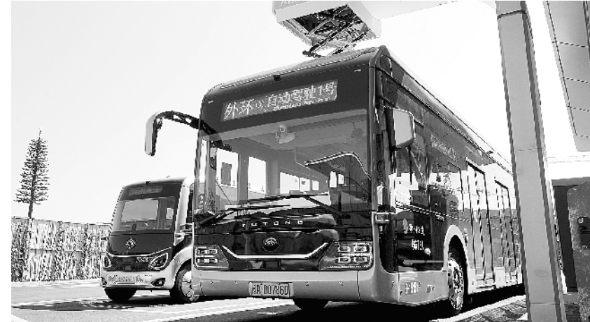
自动驾驶公交亮相郑州 郑州市郑东新区自动驾驶公交1号线车辆在充电站内充电(8月18日摄)。近日,郑州市郑东新区自动驾驶公交1号线进行试运行。此次试运行的自动驾驶公交项目,采用5G信号覆盖、车路协同、人工智能等先进技术,结合智慧站台、智慧场站等一体化管控系统,实现自动驾驶车辆智能监控、安全预警和与其他社会车辆的协同运行。

国家统计局农村司司长李锁强介绍,今年早稻生产虽然受南方部分地区严重洪涝灾害的不利影响,单产有所下降,但得益于播种面积的大幅增加,全国早稻实现增产。