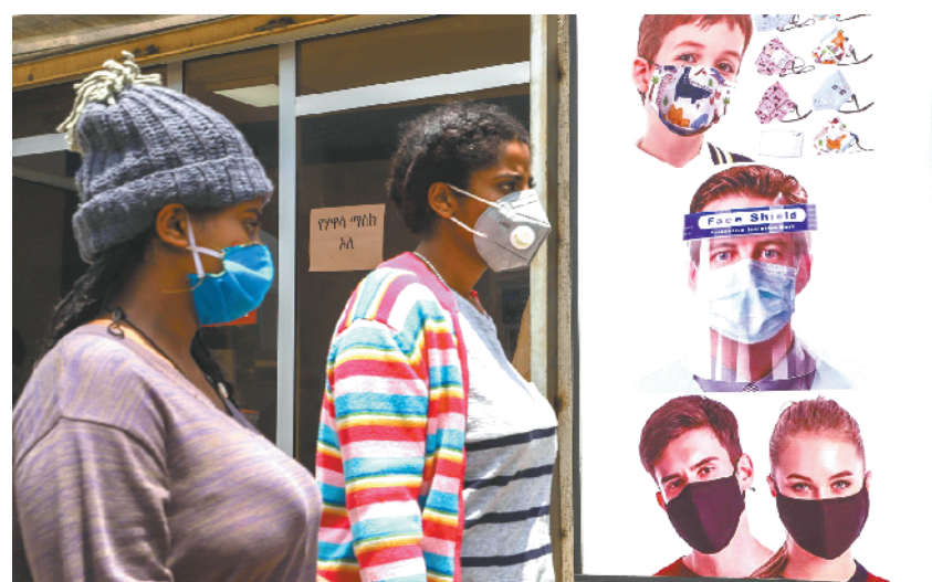
埃塞俄比亚加强防疫宣传 8 月 21 日, 行人在埃塞俄比亚首都亚的斯亚贝巴街头经过防疫宣传广告牌。埃塞俄比亚政府在首都亚的斯亚贝巴树立了大量公益广告牌以加强防疫宣传。埃塞俄比亚卫生部 22 日发布的数据显示, 该国累计新冠确诊病例达 39033 例。