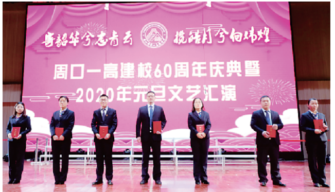
建校60周年表彰优秀教师。