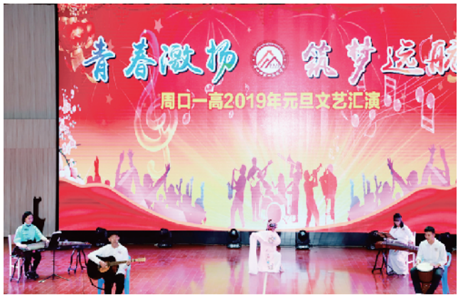
师生元旦文艺汇演。