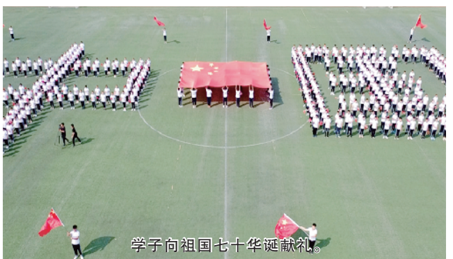
学子向祖国七十华诞献礼。