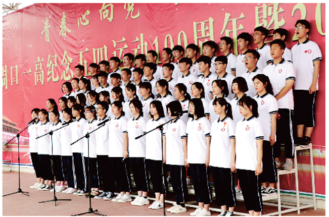
纪念五四运动100周年红歌汇演。