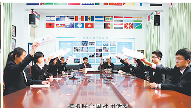
模拟联合国社团活动