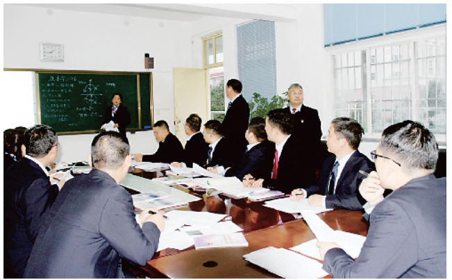
校领导参与教师集体备课。