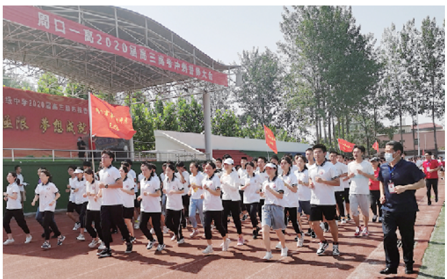
校领导与学生一起跑操。