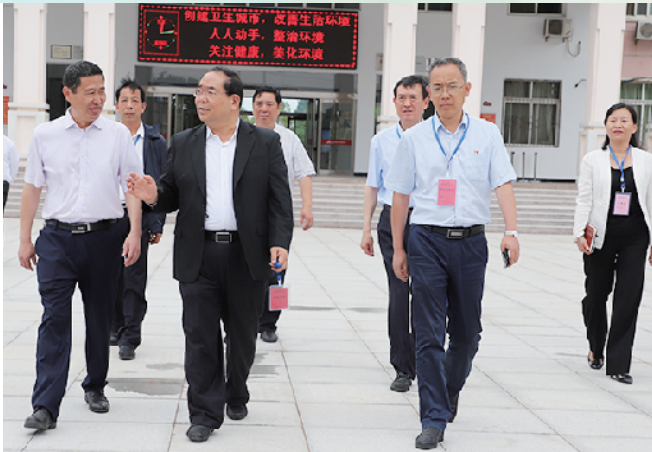
市长丁福浩一行到校调研，全力服务学校优质运行。