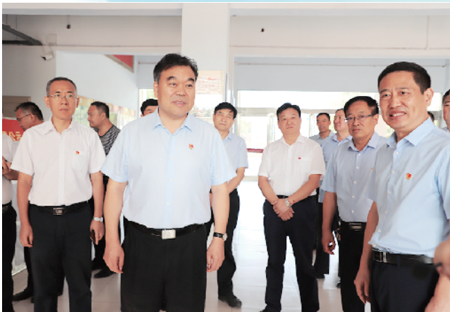
市委书记刘继标一行到校现场办公，并慰问教师。